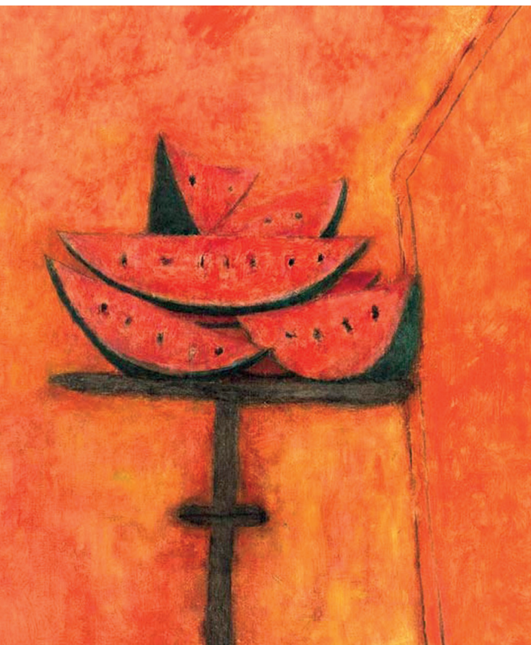
Tajadas de sandía, 1950

de sus raíces. El mural El día y la noche , que se ubica en el Museo Nacional de Antropología e Historia de México, realizado en 1964, simboliza la lucha entre el día —representado por la serpiente emplumada— y la noche —presente en la forma del jaguar—. Este se considera como su gran obra mural.