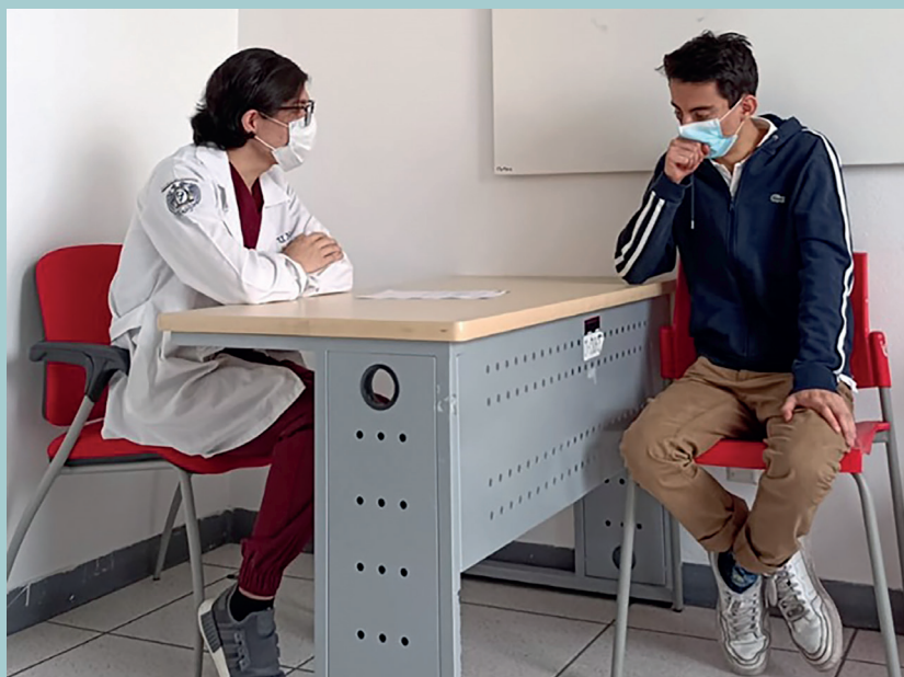
Figura 3. Consulta simulada durante la anamnesis