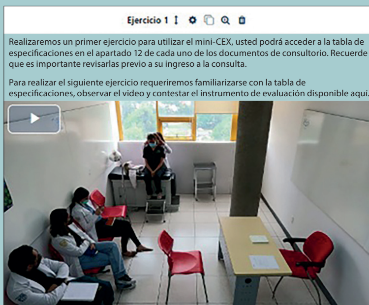
Figura 2. Curso de evaluadores DICiM y tabla de especificaciones