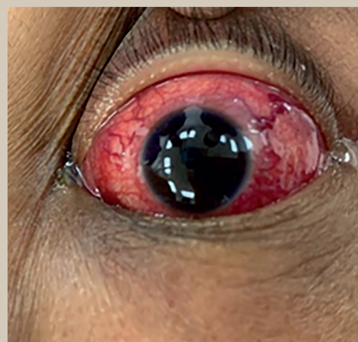
Figura 1. Tumoración ocular izquierda que condiciona proptosis e hiperemia subconjuntival.

Tomografía cráneo-toraco-abdominal que reportó a nivel ocular lo descrito en la figura 2 sugestiva de melanoma corioideo, y a nivel cerebral, ganglionar, hepática, pulmonar u ósea sin actividad metastásica.