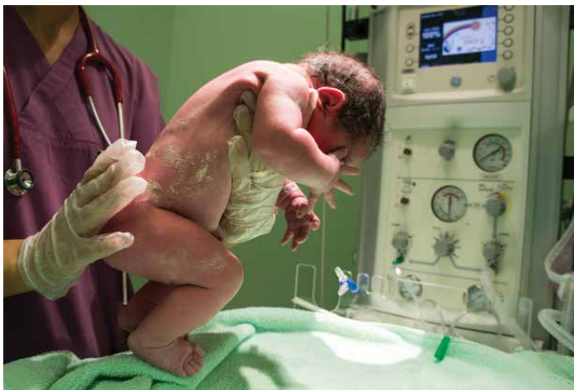
Imagen: Geraldo-Murillo et al.