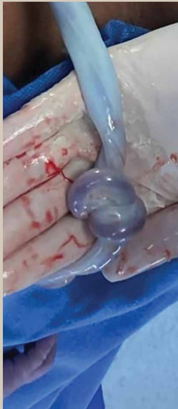
Figura 2. Nudo verdadero ajustado del cordón umbilical al momento del parto.

En el presente reporte de caso registramos un caso de taquicardia fetal persistente asociado a nudo verdadero diagnosticado como hallazgo durante el parto y sin efectos adversos en el neonato. En nuestra paciente, se identificaron dos principales factores de riesgo; la multiparidad y el sexo masculino del feto. Se ha reportado que los neonatos con nudo verdadero de cordón umbilical tienen mayor riesgo de hipoglucemia y necesidad de fototerapia, pero sin aumento de la mortalidad neonatal 4 . Räisänen et al. 8 reportaron una asociación entre nudo verdadero y la admisión a cuidados intensivos neonatales con un Apgar bajo a los 5 minutos. En este reporte de caso, el neonato respiró y lloró al nacer con un Apgar 9/9 y peso adecuado para la edad gestacional, a pesar de cursar con taquicardia fetal persistente, en el registro cardiotocográfico no se observaron datos de sufrimiento o hipoxia fetal al nacimiento y tras una adecuada progresión se optó por la terminación