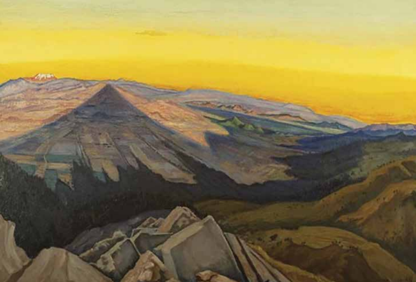
La sombra del Popo, 1942

Por sus trabajos sobre las iglesias de México y las artes populares, mismas que lograron gran repercusión en su época, se le reconoció con la medalla “Belisario Domínguez” en 1956 y el Premio Nacional de Artes en 1958. 8