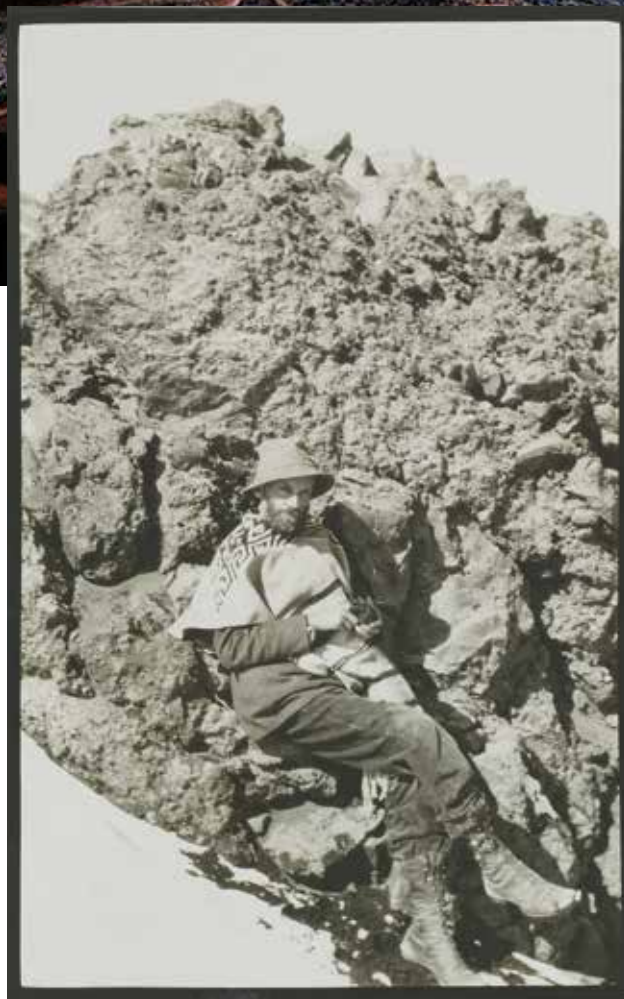
Dr. Atl en el Popocatepetl, 1922

Tan apasionante vida sólo podría surgir de quien hacía de la pasión su modus vivendi . Y si de pasión hablamos, es obligatorio asociar al Dr. Atl con su musa y pareja, Carmen Mondragón, mejor conocida como Nahui Olín, a la que ya hemos hecho referencia con anterioridad y a quien impulsó por el camino del arte. Su carácter explosivo y su demanda de amor total hicieron de su pasión, una que al mismo tiempo destruye. La relación se rompió y concluyó mal cuando ella estuvo a punto de terminar con la vida de su mecenas, al intentar dispararle mientras éste dormía 7 .