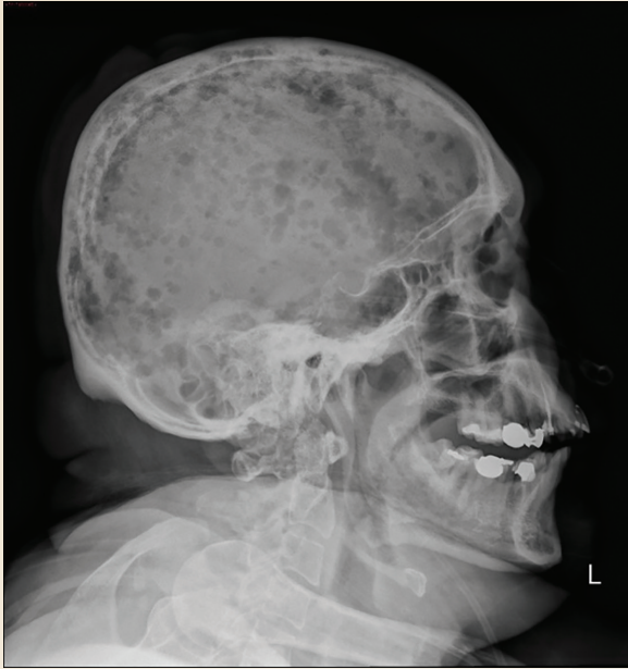
Figura 1. Radiografía lateral de cráneo