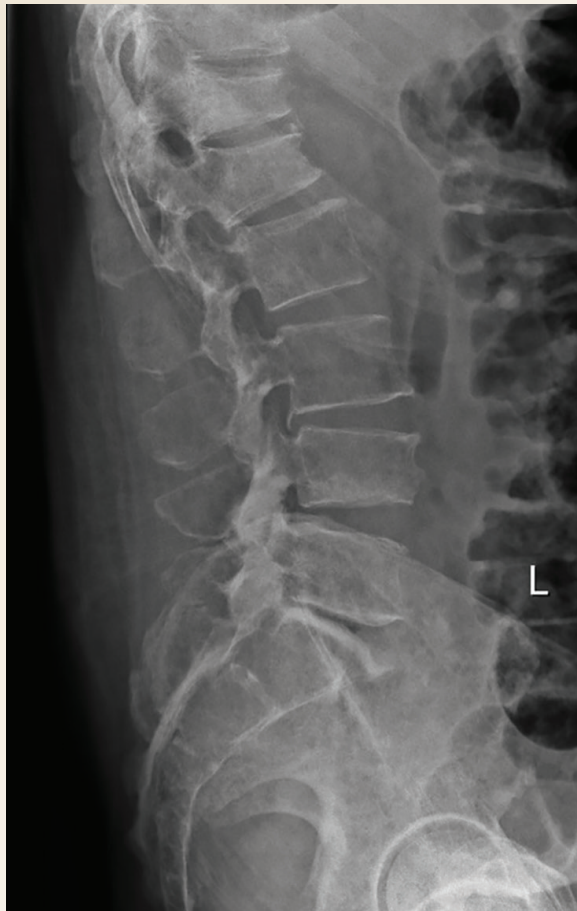
Figura 3. Radiografía lateral de columna