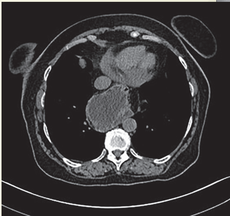
Figura 3. Tomografía axial computada en fase simple