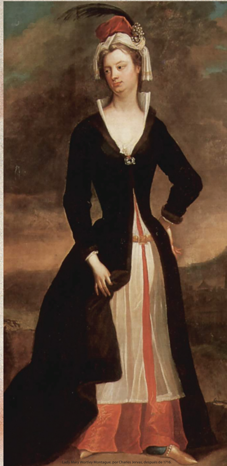
Lady Mary Wortley Montague, por Charles Jervas, después de 1716.

Lady Mary Wortley Montagu, hija de Evelyn Pierrepont primer Duque de Kingston-upon Hull, decidió leer y aprender por su cuenta latín. Su ambición era dedicarse a escribir y casarse con la persona que ella eligiera, no a quien le seleccionaran. Así eligió a Edward Wortley Montagu, que tenía ambiciones políticas. Ya casados, se le comisionó como embajador en el Imperio Otomano en Constantinopla y, sin titubear, Lady Mary no aceptó un NO, cuando él sugirió que se quedara en Londres con su hijo, por lo largo del viaje y lo peligroso. Su curiosidad la acercó a las mujeres del harem; le llamó la atención la piel de éstas, que no presentaban las cicatrices que dejaba la viruela; a la vez, observó que se practicaba un procedimiento que realizaban algunas mujeres y que consistía en ocasionar una serie de abrasiones que ocasionaran sangrado, con una aguja en la piel de los niños y niñas, y se mezclaban con el producto de las pústulas de sujetos que hubiesen padecido la enfermedad. El resultado