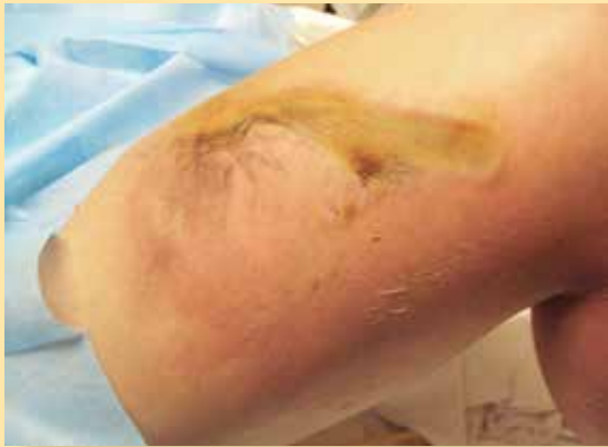
Figura 4. Quemadura de muslo derecho localizada en su cara externa, tercio medio.

derecho en su tercio medio ( figura 4 ), así como con arborizaciones de Lichtenber en cara interna de la rodilla izquierda ( figura 5 ).