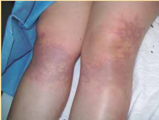
Figura 2. Figuras de Lichtenberg en rodillas y tercio proximal de ambas piernas.