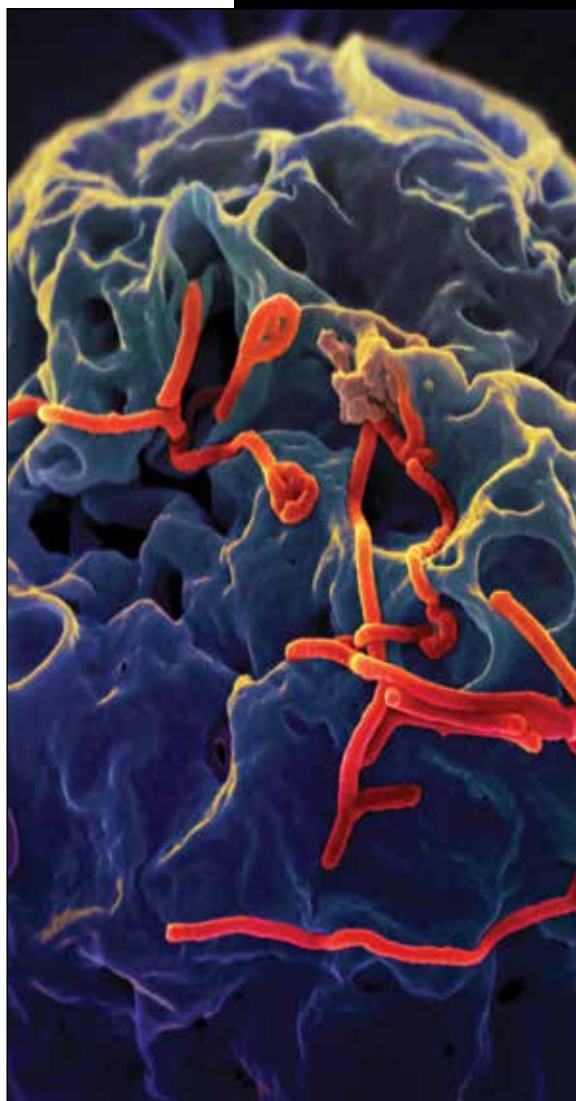
Micrografía electrónica de barrido del virus del Ébola (en rojo) en la superficie de una célula de cultivo de la línea celular de primates.