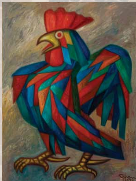
Gallo (1978). Óleo sobre tela, 84.5 x 65 cm.