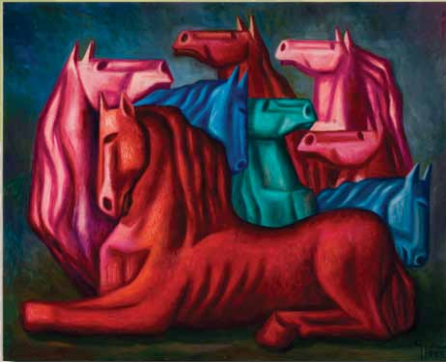
Caballos de Colores (1985). Óleo sobre tela.