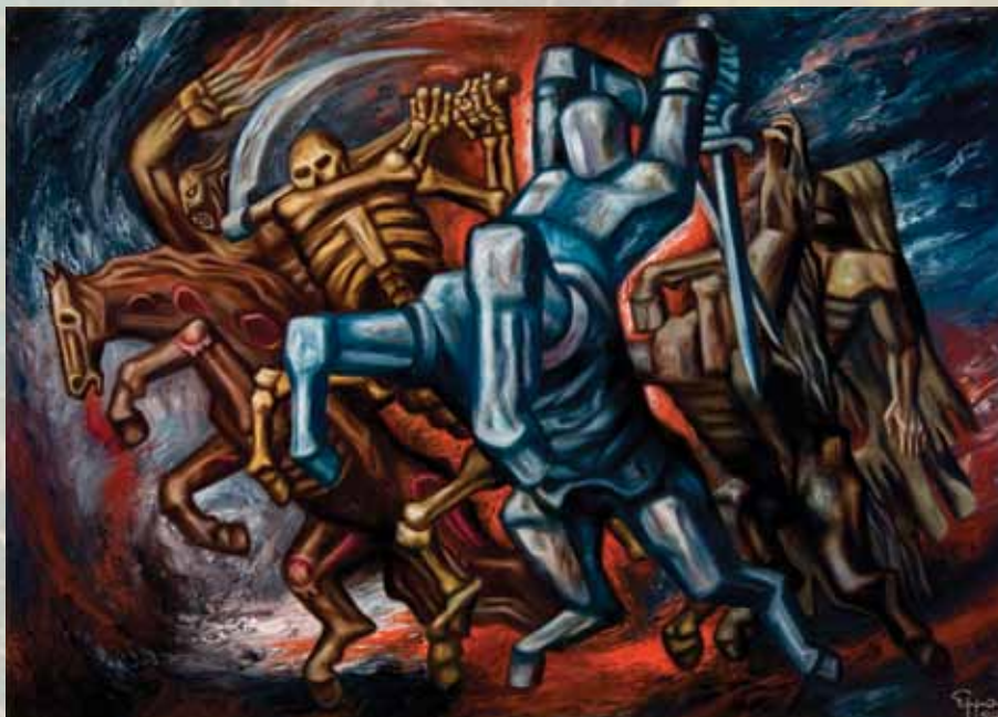
Los Cuatro Jinetes del Apocalipsis (1984). Óleo sobre masonite, 109 x 80 cm.