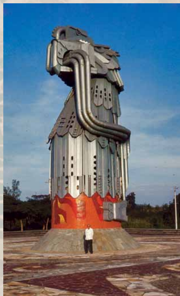
Monumento La Industria Nacional del Acero (1973-1974). Escultura de acero y mural de mosaico de vidrio. Ciudad Industrial Bruno Pagliai, Framboyán, Veracruz.

A cien años de su nacimiento, Arte y Medicina hace un pequeño homenaje a quien erigió la obra paradigmática de nuestra Facultad. ●