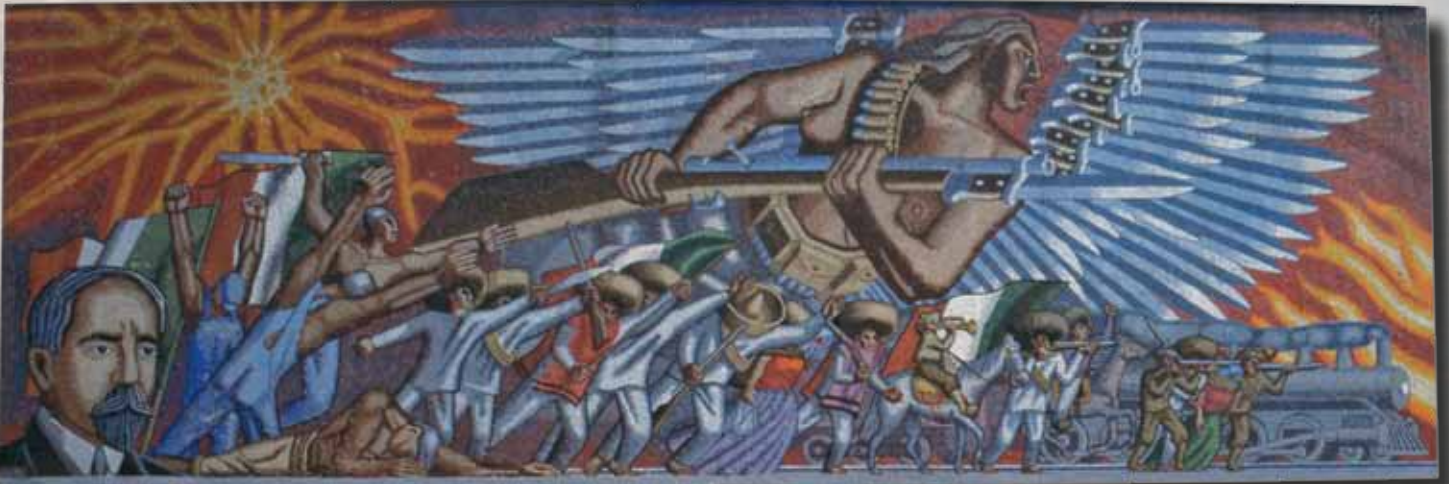
Mural La Revolución (1963). Mosaico de vidrio de 31 x 10 m. Edificio del Partido Revolucionario Institucional, México, DF. Ganó un concurso Nacional entre 52 participantes.