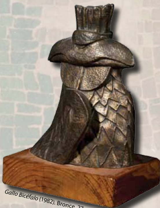
Gallo Bicéfalo (1982). Bronce, 27 x 12 cm.