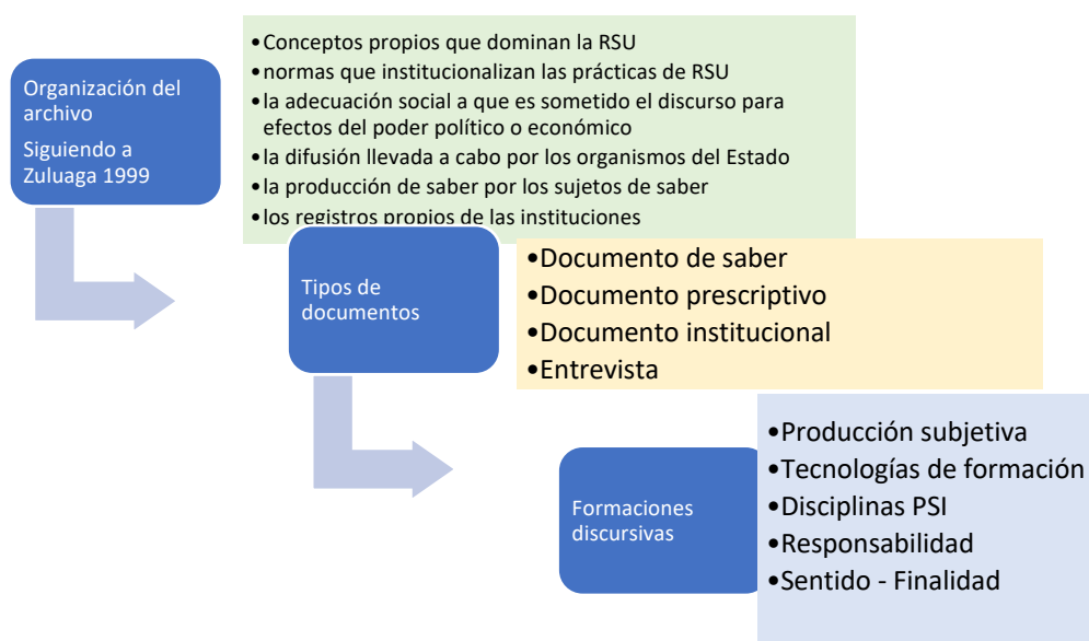
Figura 2 Proceso metodológico del análisis del archivo

Nota. La figura explica el proceso metodológico que llevó al análisis del archivo.