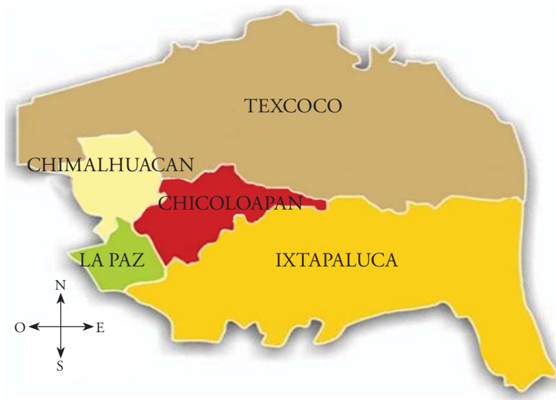
Mapa 1. Colindancias físicas

rrero Chimalhuachi. Existe una ocupación urbana intensa e irregular en su parte norte como continuación de los barrios; se han incorporado al uso urbano predios con actividad agrícola. La zona comprende diez localidades.