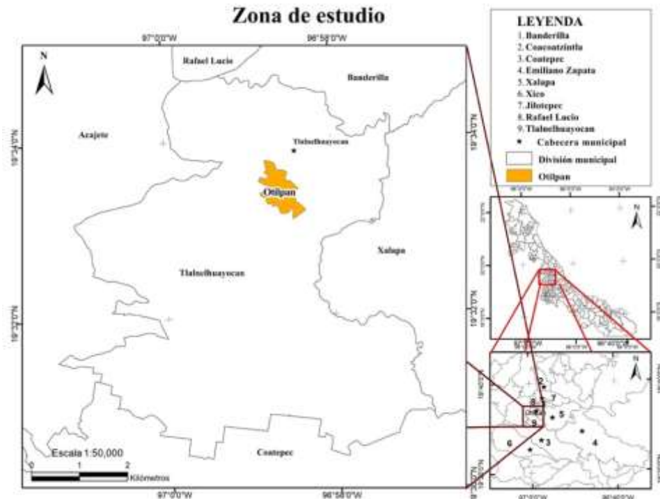
Figura 1. Localización geográfica de la comunidad de Otilpan, Municipio de Tlalnahuayocan.

La comunidad de Otilpan en donde viven las integrantes de la cooperativa Manos Mágicas, pertenece al Municipio de Tlalnahuayocan, ubicado al oeste de la ciudad de Xalapa, a ocho kilómetros de esta (figura 1).