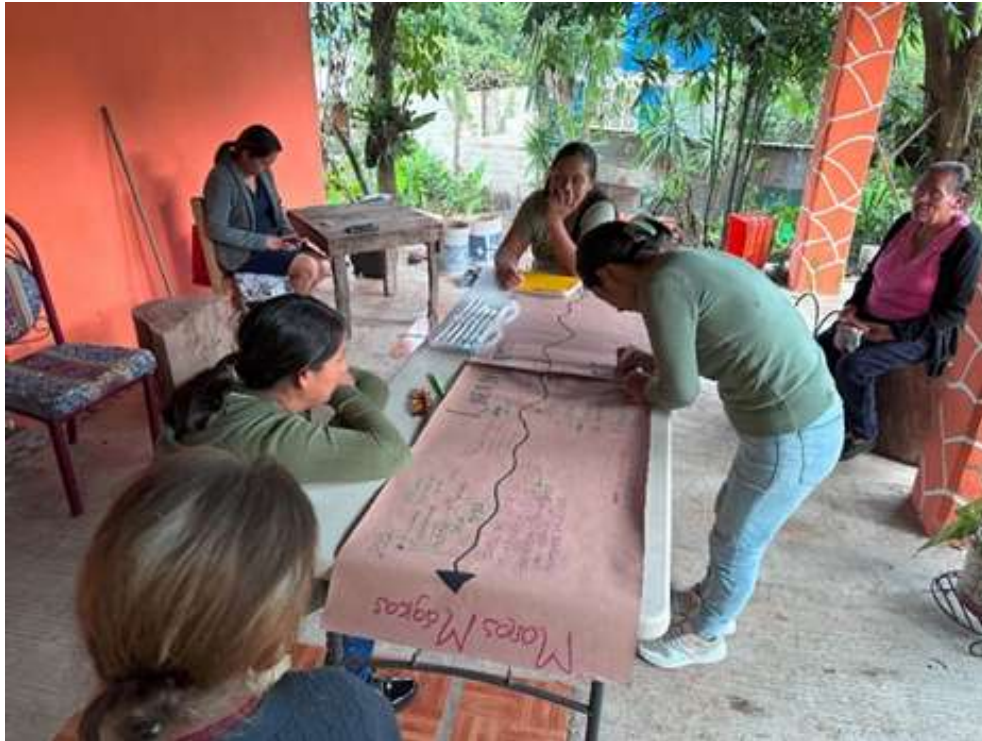
Imagen 1. Realización de la línea del tiempo.

integrando descripciones, situaciones, interacciones y reflexiones generadas durante las sesiones (Emerson, Fretz y Shaw, 2011).