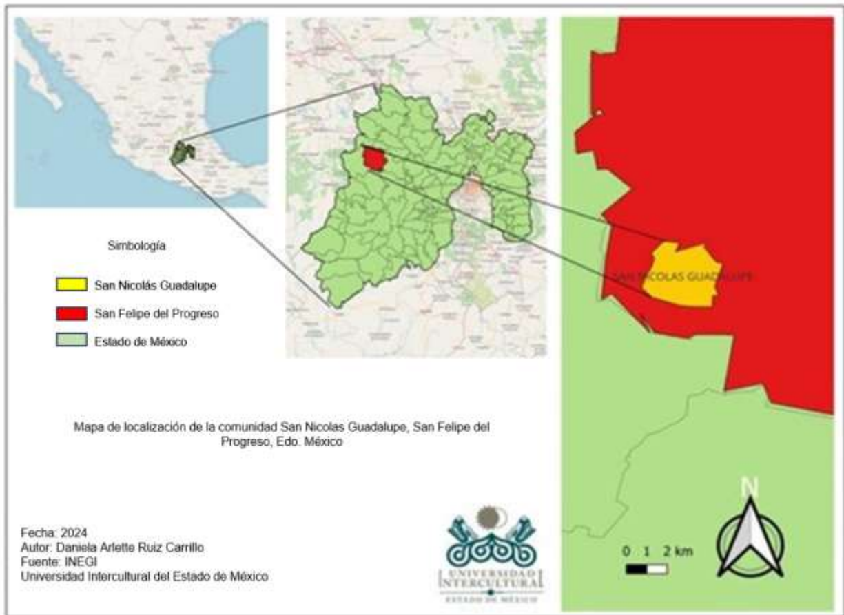
Figura 1. Área de estudio San Nicolás Guadalupe, San Felipe del Progreso Estado de México.

Ruiz-Carrillo, Albino-Garduño, Tejocote-Pérez, Pillado-Albarrán, Santiago-Mejía, Salazar-Lara