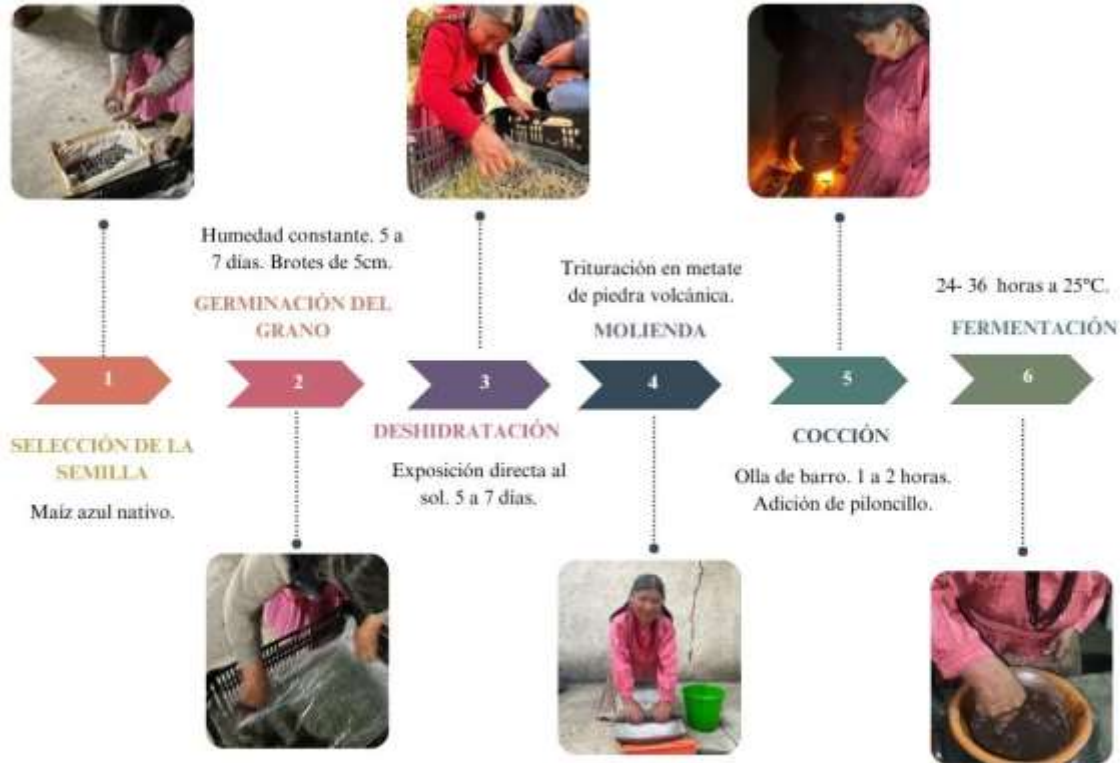
Figura 3. Proceso de elaboración tradicional del Sendejho en San Nicolás Guadalupe Estado de México.

Ruiz-Carrillo, Albino-Garduño, Tejocote-Pérez, Pillado-Albarrán, Santiago-Mejía, Salazar-Lara