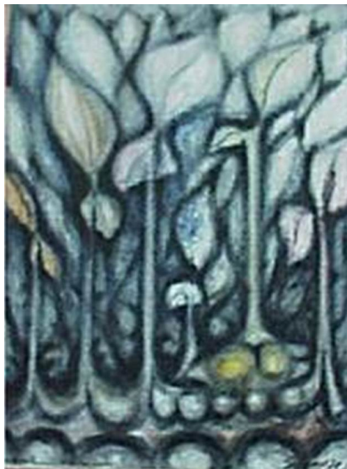
Figura 1. La arquitectura es un impulso.

Desde el punto de vista metodológico, se han elegido las posibilidades del trabajo con proyectos, a causa de la riqueza de material acumulado acerca de comunidades rurales (véase MST, 2019). Entre las diversas opciones de trabajo con proyectos, se destacan: “proyectos de enseñanza”, “proyectos de trabajo”, “proyectos de aprendizaje”, “temas generadores”, “metodología del complejo temático”, entre otros (véase Hernández, 1998). De ese modo, las metodologías de trabajo con proyecto proporcionan más flexibilidad de estrategias al profesor y más libertad al educando, posibilitando un aprendizaje que de hecho corresponda a las necesidades reales de la comunidad.