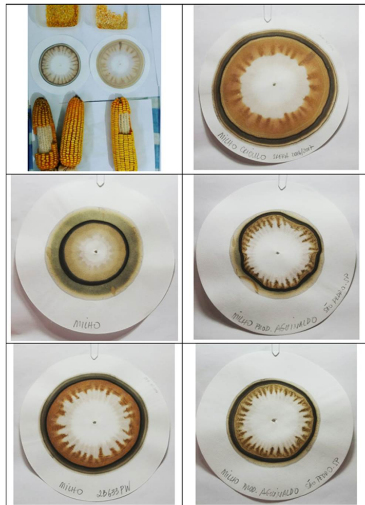
Figura 4. Cromas de maíz criollo y transgénico.

A seguir, en la Figura 4, presentamos una comparación entre cromas de maíz criollo y transgénico. En sentido horario, 1) espigas de maíz criollo y transgénico; 2) maíz criollo, con preparación mínima del suelo con encalado y harina de rocas, además de la aplicación de biofertilizantes durante su desarrollo y de la utilización del sistema de milpa (consorcio de maíz, frijol y calabaza); 3) la misma semilla de maíz criollo anterior, cultivada por el productor Aguinaldo (São Pedro/SP, Brasil). El sistema de producción utilizado ha sido el convencional. Para acceder a la historia de los saberes tradicionales, del territorio campirano, en el estado de São Paulo, Brasil, sugerimos leer: Candido (2001), Villela (2016a) y Dória y Bastos (2018).