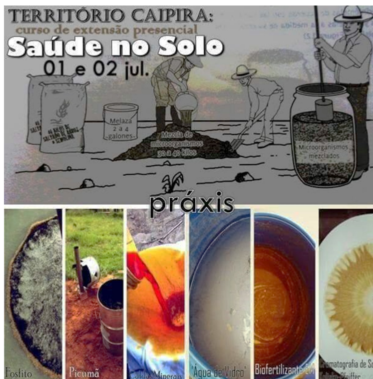
Figura 2. Volante con imágenes de la praxis de los cursos de extensión.

Se han organizado diversos cursos de extensión entre 2016 y 2019 en los cuales se han experimentado los procesos descritos anteriormente. Los cursos se destinaron a los alumnos del Ibilce/Unesp y a la comunidad general que deseara obtener una formación específica en el área de educación del campo, en particular para desarrollar trabajos y/o investigaciones con la interfaz agroecología, agroforestería y salud en el suelo. Algunos temas del curso han sido: 1. Cultura Ambiental (véase 2016a); 2. Salud en el Suelo (Blanco, 2020, 2017 e 2013); Agroforestería (Costa et al., 2014) y 3. Agricultura Sostenible (Nagai y Kishimoto, 2008). Se puede acceder a una primera elaboración de los resultados de esta discusión en Villela (2018). A seguir, presentamos la Figura 2 con algunos elementos de la praxis de los cursos de extensión: fosfite, hollín, lechadas minerales, agua de vidrio, biofertilizantes y la cromatografía de Pfeiffer (véase Blanco, 2017).