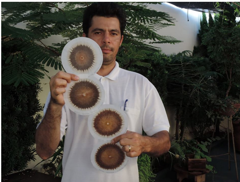
Figura 3. Cromas de Pfeiffer. Fuente: Blanco, 2020.

¿Qué se busca en un cromatograma? Para Blanco (2017), se busca la lectura de la vida, de la calidad de vida del suelo, en un determinado momento. Eso se visualiza fácilmente en un cromatograma por medio de la armonía de colores y dibujo entre los diferentes componentes del suelo: mineral, orgánico, energético, electromagnético. Así, es posible saber si un determinado mineral está en armonía con la materia orgánica, el pH, la biodiversidad de microorganismos o grado de oxidación/reducción de enzimas, vitaminas y proteínas, y cómo se puede cambiar positivamente la situación hallada para alcanzar esa meta (Blanco, 2017).