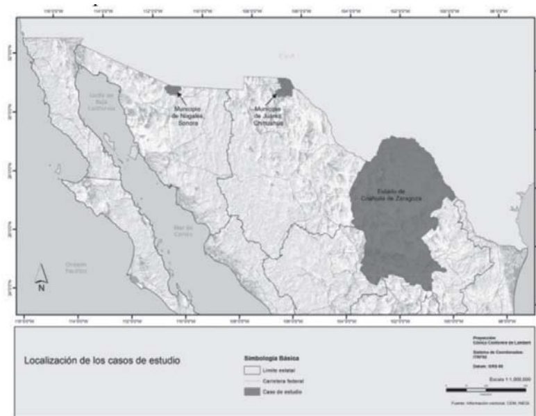
Mapa 1. Localización de casos de estudio