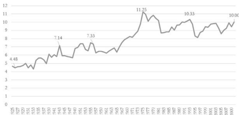
Gráfica 1. Recaudación tributaria en México 1925-2010 (% del PIB)