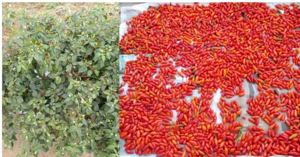
Figura 1. Chile piquín ( Capsicum annuum var. Aviculare)

Se utilizó un genotipo de chile piquín colectado en el municipio de Papantla, Veracruz (Figura 1). El chile piquín, fue sembrado bajo un diseño de bloques al azar con cuatro repeticiones y arreglo de tratamientos en parcelas divididas; la parcela grande correspondió a la cobertura de suelo y la chica a densidades de siembra con los niveles de 25 000, 16 667 y 12 500 plantas ha -1 ; la unidad experimental fue de cuatro hileras de 4 m de longitud con distancia entre surco a 0.80 m.