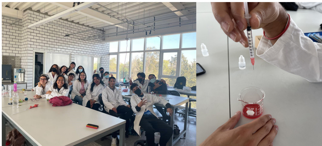
FIGURA 1. Izquierda, estudiantes de QA 2023-2. Derecha, estudiantes ensayando la técnica de microtitulación complejométrica en el SUM 201 de la ENCIT.

El objetivo de las mediciones realizadas en campo es enfatizar la importancia del aprendizaje del estudiantado en la realización del análisis químico in situ , así como el registro y análisis de los resultados de las pruebas como un indicativo de la calidad del agua.