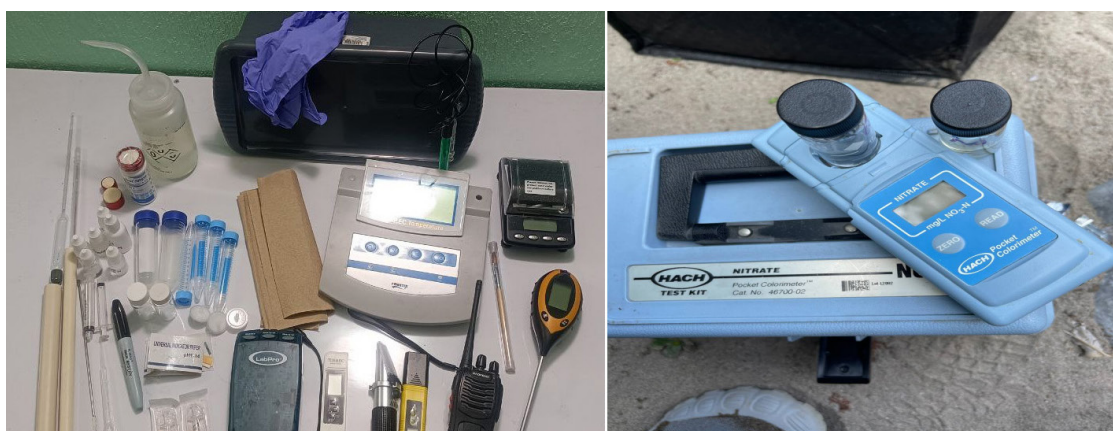
FIGURA 2. Materiales e instrumentos de medición utilizados.

Con las muestras recolectadas y utilizando las mismas técnicas, en el laboratorio se repitieron los experimentos de los puntos 2 y 3, es decir, el análisis volumétrico y la colorimetría para la determinación de la concentración de nitritos y nitratos.