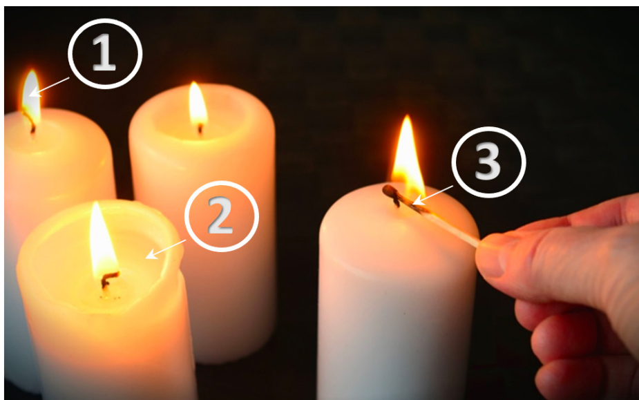
FIGURA 1. Ejemplo de fotografía usada en la identificación de cambios químico y/o físicos. Los cambios identificados por los estudiantes están numerados en la imagen.

En la aplicación de la técnica del rompecabezas, la docente observó una actitud favorable de los estudiantes, éstos interactuaron en sus equipos de base y con los miembros de otros equipos, siendo elevada también la participación de los alumnos a la hora de recabar y compartir información acerca de los experimentos llevados a cabo en el laboratorio. En cuanto a los informes elaborados por los equipos durante la sesión de laboratorio, la mayoría de ellos evidenciaban que los estudiantes tenían dificultades con los cálculos estequiométricos y, algunos estudiantes, seguían mostrando dichas dificultades en la prueba de evaluación de carácter individual.