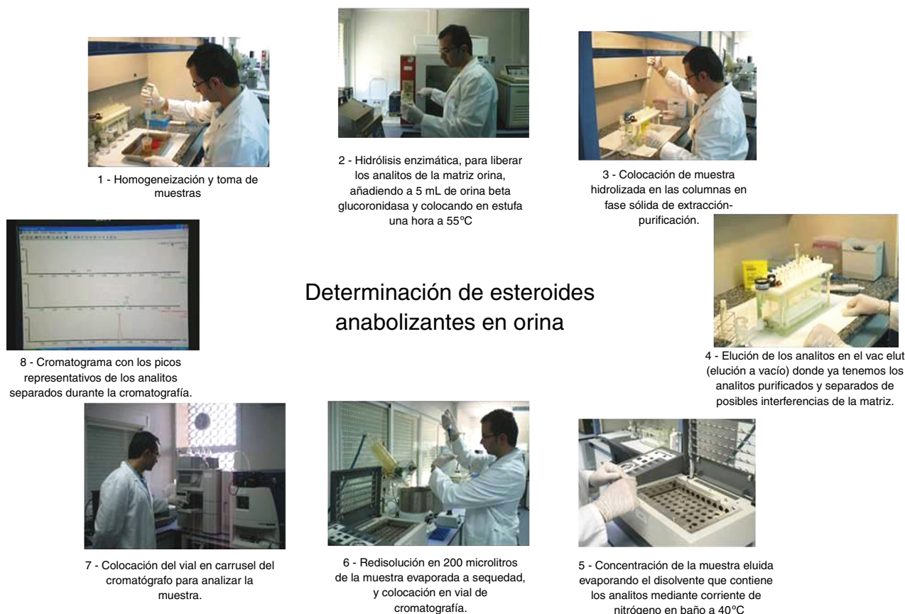
Figura 1 Capturas de pantalla sobre el video del proceso de determinación de esteroides anabolizantes en orina.

aspectos que valoran como muy positivos los participantes son la organización y estructura de la clase, el tiempo invertido en el trabajo fuera y dentro del aula, los videos diseñados por el profesor y su influencia en el desarrollo de