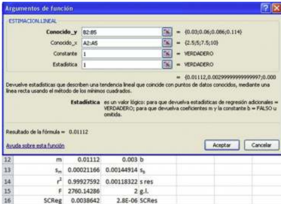
Figura 3 Formulario de la función ESTIMACION.LINEAL y matriz de resultados (ejemplo 1).

B2:B12, y para los de x se escribe A2:A12 {1,2} . En los otros 2 cuadros se introduce un 1 o el valor lógico VERDADERO. Una vez completado el formulario (fig. 4), se pulsa «Ctrl» + «Shift» + «Enter». Los coeficientes para el término cuadrático, de primer orden y el término independiente se obtienen en las celdas A16, B16 y C16, respectivamente, y sus errores en las celdas inmediatamente inferiores. En