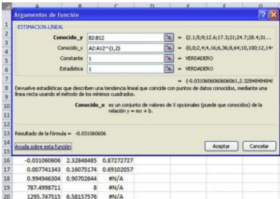
Figura 4 Formulario de la función ESTIMACION.LINEAL y resultados para el ajuste a un polinomio de segundo grado (ejemplo 3).

Cuando se emplea una configuración de idioma de Windows en español (México) la fórmula completa es =ESTIMACION.LINEAL(B2:B12,A2:A12 {1,2} ,1,1). En español (España), la fórmula queda =ESTIMACION.LINEAL(B2:B12;A2:A12 {1\2} ;1;1). En la versión de Excel 2007 los separadores