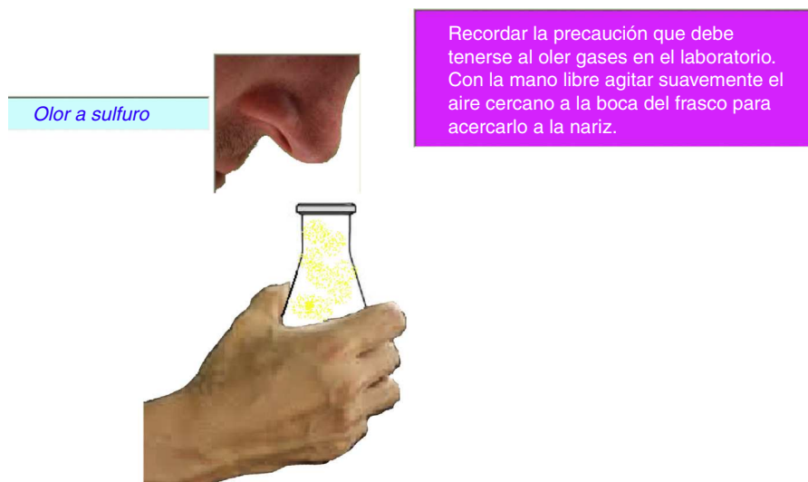
Figura 3 Pantalla en que se indica la detección de olor.

ya que es necesario diferenciarlo del blanco del monitor. Como se ve en la misma figura, este color es distinto al sobrenadante del Erlenmeyer.