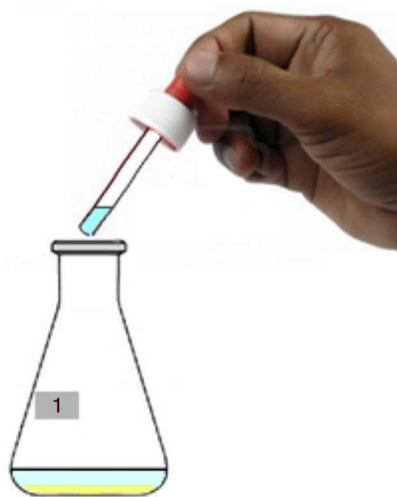
Figura 4 Precipitación de AgBr en la mezcla de los frascos 1 y 4 de la combinación 7.

Realizando todas las combinaciones posibles, de 2 en 2, se puede completar un cuadro como el que se presenta en la Tabla 2 . Si bien el alumno puede registrar la información de la manera que le resulte más cómoda, sugerimos utilizar la siguiente clave de 2 caracteres, o 3 en caso de liberarse un gas, que es la que usa internamente el programa: