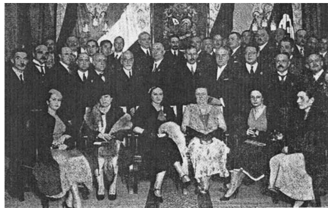
Foto 2. Los ilustres farmacéuticos extranjeros en la “Casa de los Farmacéuticos Españoles”.