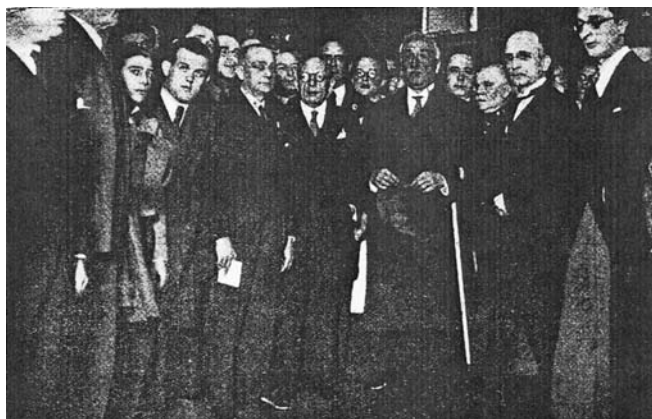
Foto 4. S.E. el Presidente de la República, ministros y otros personajes ilustres a la salida de la sesión inaugural.

Aun regresaría una tercera vez, en 1935, y daría una conferencia en la Facultad de Farmacia sobre el desarrollo de la química de los medicamentos. 7