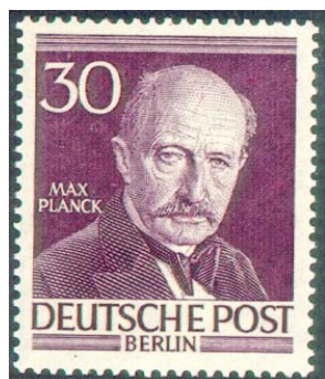
Figura 2. Sello alemán.

El 19 de octubre de 1900, en la Universidad de Berlín, Planck