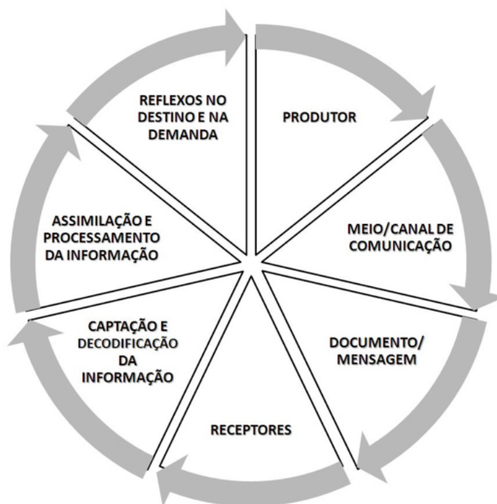
Figura 4: Ciclo da informação e reflexos no destino turístico