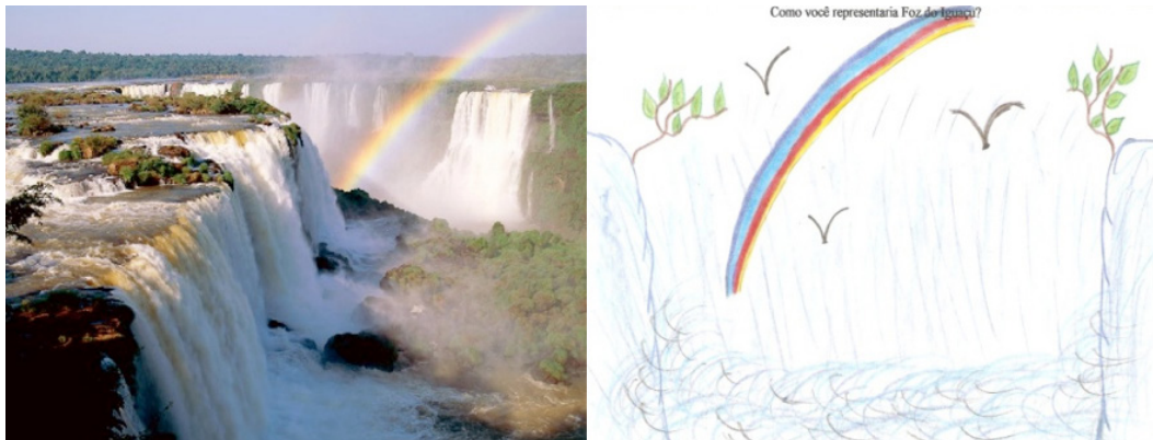
Figuras 1 e 2. Cataratas do Iguaçu Real e Imaginária (representada)