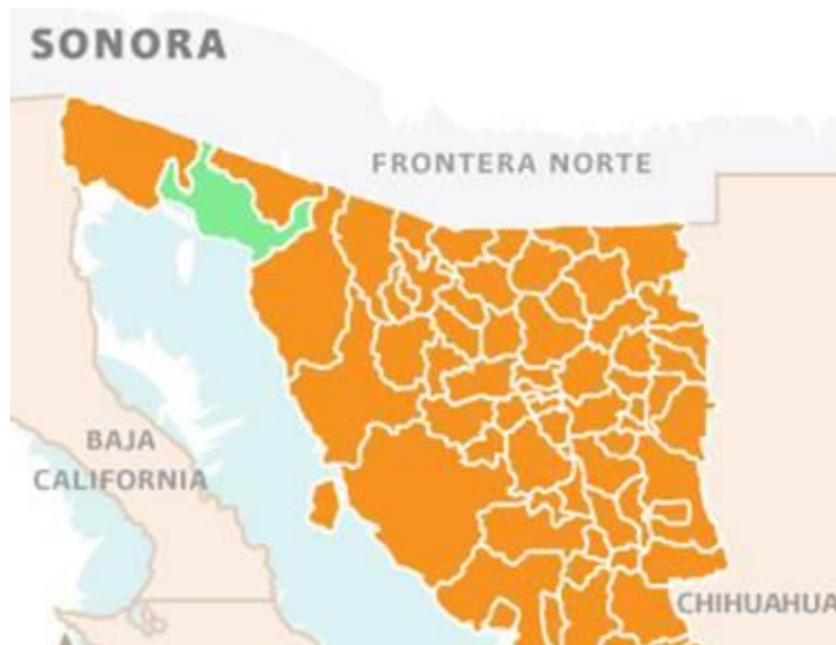
Imagen 1. Municipio de Puerto Peñasco.