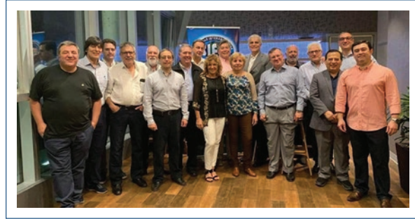
Figura 5. Consejo de gobierno durante la reunión cumbre de Montevideo. Marzo, 2019.

Posteriormente y a lo largo de todo el periodo de gestión se continuó trabajando de igual manera, donde todas las grandes decisiones fueron tomadas siempre en forma consensuada, informada y, como mencionamos, participativa (Fig. 6).