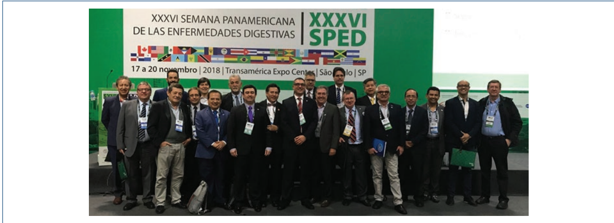
Figura 2. Asamblea general. San Pablo, Brasil, 2018.