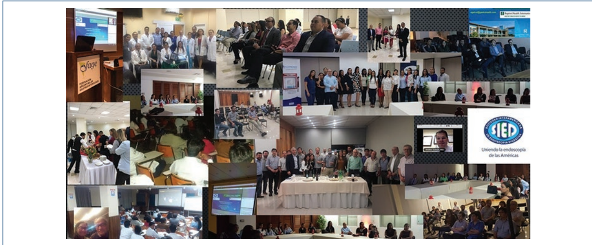
Figura 8. Sociedades miembros conectadas vía internet durante el primer Webinar SIED. 20 de marzo, 2019.