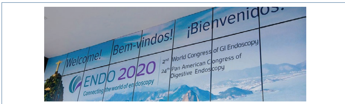
Figura 9. Banner de bienvenida al 2º Congreso Mundial de Endoscopia Digestiva y el 24º Congreso Panamericano de Endoscopia Digestiva, ENDO 2020.