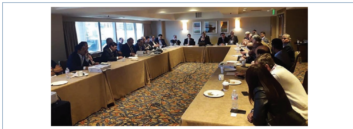
Figura 7. Asamblea general, San Diego, California, 2019.

serie de actividades que marcaron un hito en el funcionamiento antes y durante la pandemia.