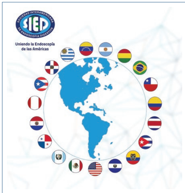
Figura 1. Carátula de la memoria entregada en el marco de la Asamblea General de cierre de gestión.

miembros plenos la Asociación de Gastroenterología y Endoscopia Digestiva de El Salvador (AGEDES) y la Asociación Puertorriqueña de Gastroenterología. En la asamblea final de esta gestión e inicio de la directiva entrante ingresó como miembro pleno la Asociación Uruguaya de Gastroenterología y Endoscopia (AUGE).