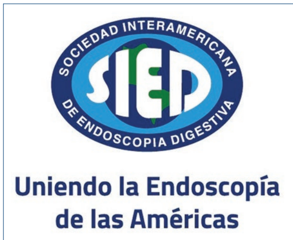
Figura 3. Logo y slogan de la SIED.