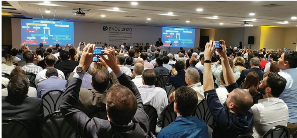
Figura 10. Audiencia en uno de los salones del 24º Congreso Panamericano de Endoscopia Digestiva, ENDO 2020.

si el destino apoyara las decisiones importantes, complejas y trascendentales, la pandemia se coló en nuestro continente al otro día de finalizar el magno evento. El programa académico, amplio y de actualidad se llevó a cabo en tres días, sumados al primer día dedicado a un imponente curso en vivo retransmitidas desde Hyderabad, India, São Paulo y Río de Janeiro, Brasil (Fig. 10).