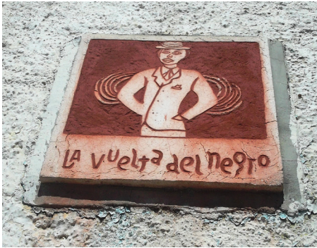
Imagen 2. Placa “La vuelta del negro”, localizada en la esquina de las calles 48 y 55, Mérida, 2018.