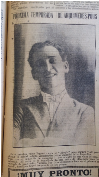
Imagen 9. Visita de Arquímedes Pous a Mérida, quien fue uno de los primeros y principales exponentes del teatro bufo cubano, sobre todo por representar al personaje del negrito. Revista de Yucatán , 2 de febrero de 1919, p. 2. Fondo Reservado de la Biblioteca Yucatanense. Fotografía de Luisangel García Yeladaqui

Allí, sobre el escenario, el negrito y la mulata asumían una extranjería cubana que los diferenciaba de la identidad yucateca, pero al mismo tiempo estaban implícitos los vínculos sociales, económicos y culturales entre Cuba y Mérida, elementos que el propio teatro regional de Yucatán había asimilado (véanse imágenes 9 y 10).