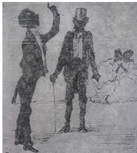
Imagen 7. Representación de los negros catedráticos (Leal, 1982, conjunto de imágenes entre las páginas 67 y 69)

Los catedráticos representaban las aspiraciones de estos grupos por parecerse y formar parte de la sociedad blanca; por tal motivo utilizaban palabras ostentosas al hablar; aparentaban elegancia con su forma de vestir y en general rechazaban su pasado africano. Irónicamente, en su intento por imitar a las personas blancas, los negros catedráticos terminaban siendo la burla de los negros bozales, sus opuestos, y además de los propios sectores blancos, quienes reían al ver a un supuesto negro civilizado y educado de acuerdo con los estándares europeos (Frederik, 1996) (véase imagen 7).