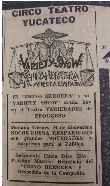
Imagen 1. Anuncio de la compañía de Daniel “Chino” Herrera con la imagen de un chino caricaturizado. Diario de Yucatán , Mérida, 28 de octubre de 1943, p. 5. Fondo Reservado de la Biblioteca Yucatanense. Fotografía de Luisangel García Yeladaqui

de otros personajes ; y, por ende, de cierto espacio de representación para aquellos individuos que no encajaban con la identidad yucateca de la época.