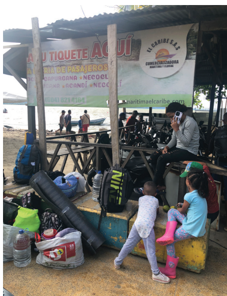
Imagen 1 Muelle de embarque hacia el Darién en Necoclí, Colombia

El miedo en la sociedad nos lleva a la búsqueda de culpables y productores del mal que viene construyéndose como una tarea de autoridades y medios de comunicación, que se constriñe al atacar los peligros de la seguridad personal desde el ámbito de la política de vida operada y administrada a nivel individual (Bauman, 2013: 13).