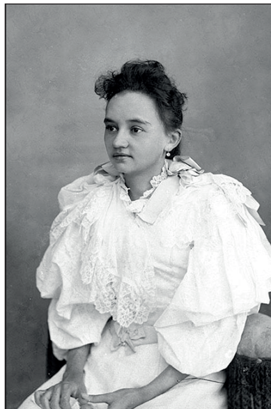
Figura 6. Fototeca Guerra, 2A052938

la apreciación visual y táctil al prolongar la figura. 78 De esta manera, por ejemplo, ciertas prendas adquieren la cualidad de potenciar la altura, realzar o prolongar una parte del cuerpo, generar distancia frente a los otros. Desde el punto de vista de Zafiro la forma de las mangas no lograba un todo orgánico y armónico entre cuerpo e indumento, sino todo lo contrario, rompía con la estética femenina y terminaba dando un efecto exagerado.