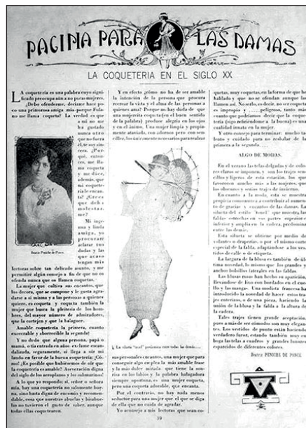
Figura 2. “Página para las damas”, Adelante. Seminario Ilustrado de Literatura, Artes y Ciencias Mérida , 30 de junio de 1917, v. 1, n. 2, 39

autores revisados preparaban contribuciones esporádicas que presentaban alguna crítica sobre el uso y apropiación de las novedades del atavío.