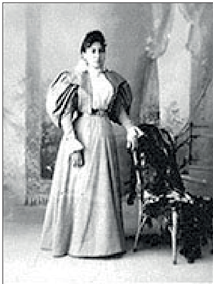
Figura 5. 2A08_847