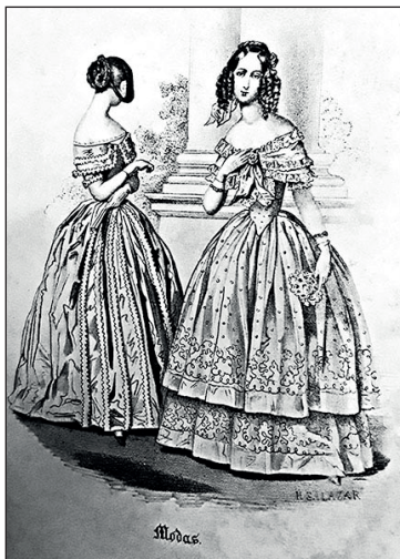
Figura 3. Juan Soplillo, “Modas”, El Liceo Mexicano , t. 1, 1844, 120