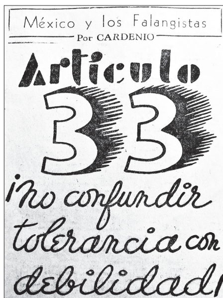
Figura 5. El Popular , 4 de abril de 1939, p. 3

la CTM o de periódicos como El Popular fueron buenos ejemplos de la actitud combativa contra el fascismo y sus distintas ramificaciones nacionales o internacionales. Incesantes fueron sus llamados a la defensa de la soberanía nacional y a la preservación de los ideales de la Revolución Mexicana como baluartes para evitar la penetración del fascismo en México. De ahí que la opinión sobre los falangistas fuese muy clara: “Pérfidos, alientan la oposición a Cárdenas y laboran contra la Revolución”. 66 Por eso, y esto es importante subrayarlo, El Popular se fue convirtiendo en la memoria impresa del alcance y hasta éxito político de la CTM.