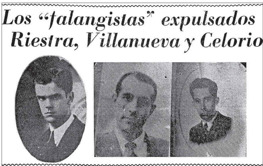
Figura 4. El Popular , 5 de abril de 1939, p. 1c

puerto de Veracruz, así como su embarcación con destino a Cuba, se hizo sin la mayor incidencia. 37