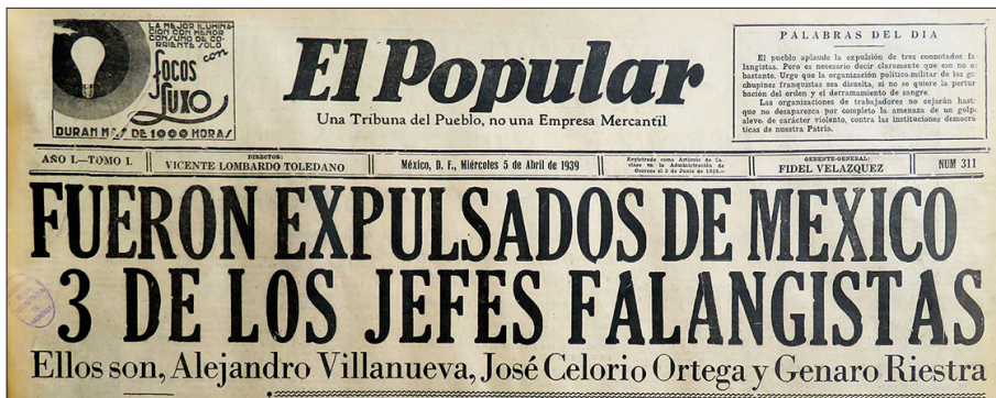
Figura 3. El Popular , 5 de abril de 1939, p. 1b