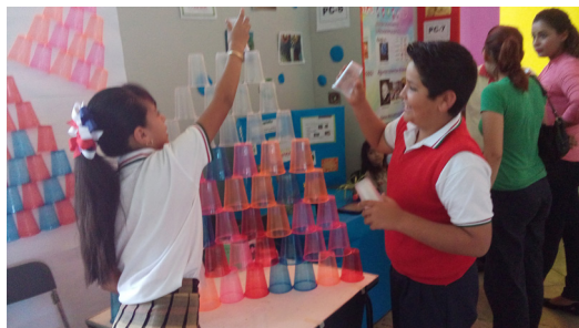
Figura 11. Participación en el concurso Expociencias.

Esta etapa se caracterizó por la divulgación, los niños dieron a conocer la propuesta, sus resultados, así como los aprendizajes que se promueven. Derivado de la presentación, la participación fue muy nutrida y atrajo el interés de grandes y chicos, fue sin duda una actividad muy enriquecedora tanto para ponentes como asistentes.