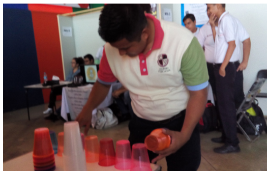
Figura 12. Participación de los espectadores.

En cuanto a los asistentes, podemos señalar que vivieron una experiencia recreativa que les causó grandes expectativas, superar sus propias marcas y las de otros; en esta etapa se consideraron retos individuales diferenciados para niños y adultos, inicialmente se invitaba a cada jugador a superar el reto, sí el jugador lo deseaba podía hacerlo varias veces, posteriormente se analizaban los tiempos y se determinaba si podía formar parte del tablero de records; seguidamente se les entregaba una hoja para completar la sucesión. Finalmente, se utilizaban los resultados planteados para exponer cómo en el juego estaban presentes las matemáticas.