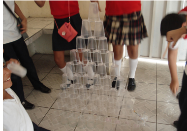
Figura 1. Equipos trabajando de manera colaborativa.

la tabla, proporcionando un resultado correcto en los términos 1°, 2°, 3°, 4°, 5°, 6°, 7° y 8°; así mismo proporcionaron argumentos en sus hojas de trabajo.