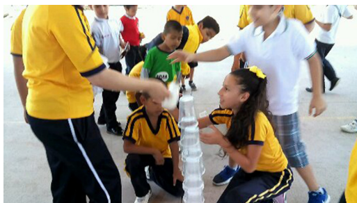
Figura 5. Los grupos de 4° realizando retos con orientación de los monitores.

Implementación. Se llevó a cabo con los grupos de cuarto grado en el patio escolar, los participantes y monitores se mostraron entusiastas en todo momento.