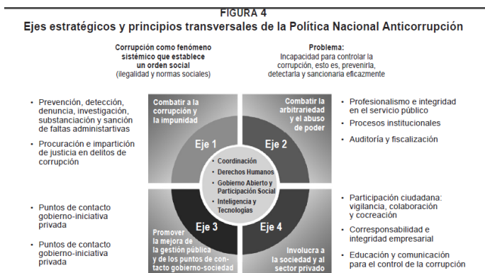
Esquema 1. Ejes estratégicos y principios transversales de la política nacional anticorrupción