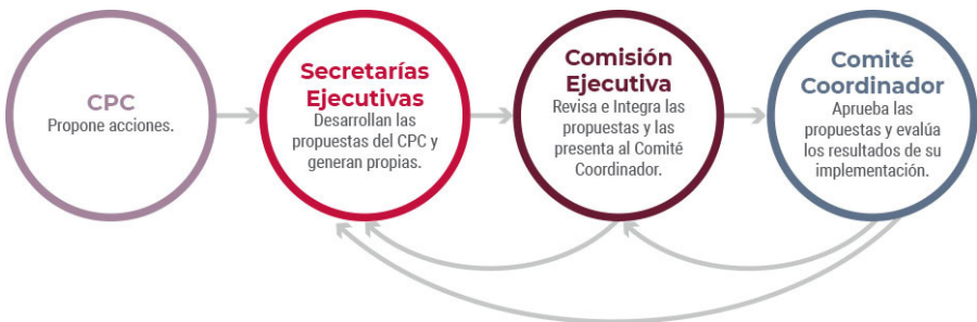
Imagen 2. Prevenir