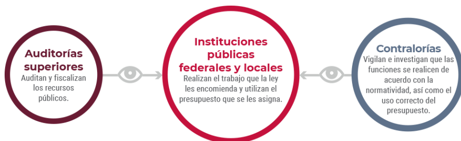
Imagen 3. Fiscalizar