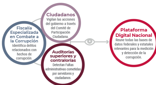
Imagen 4. Detectar