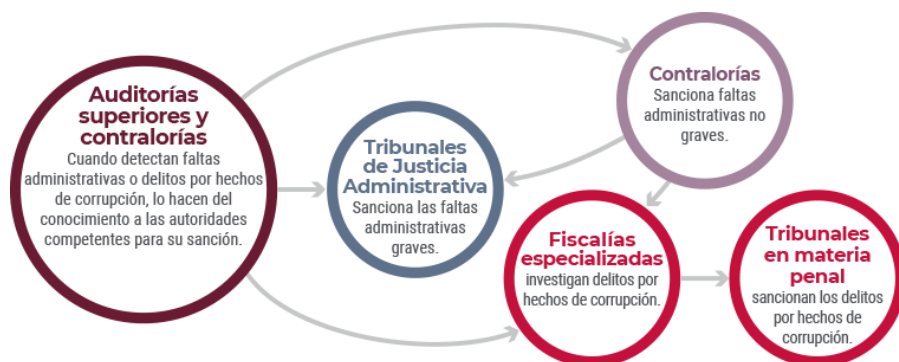
Imagen 5. Garantizar un derecho humano