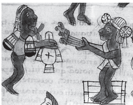
Figura 9. El sacerdote con la xiuhcouatl (serpiente de fuego), sobre el quauhxicalli En la fiesta de Panquetzaliztli, Sahagún, Ms. Biblioteca del Palacio