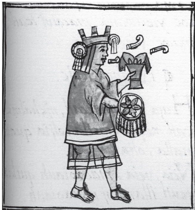
Figura 6. Chicome couatl (Siete serpiente), la diosa del maíz. Sahagún, MS. Biblioteca Laurenziana

capítulo del libro cuarto: –“Este Chicome coatl era signo de todos los mantenimientos y bien afortunado, y era sétimo, el cual número era bien dichoso”.