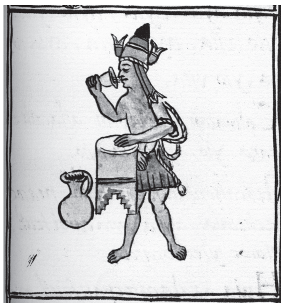
Figura 5. Yoallauana (bebedor nocturno). Xipe Totec. Sahagún, Ms. Biblioteca Laurentiana