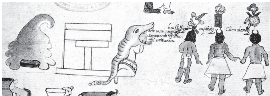
Figura 1. Colhuacan y Cihuacoatl, la diosa de Colhuacan y los cautivos de los mexicanos, el cacique Huitzilihuitl y sus dos hijas Tozpanxoch y Chilamaxoch

mexicano, en cuyo carácter marcial, la idea de una guerrera, o de una diosa de la guerra, es especialmente prominente, lo cual se basa en el paralelismo entre el alumbramiento de la mujer, con la lucha y la toma de cautivos de los guerreros. Durante los diez días anteriores a la fiesta de Toxcatl , el mancebo que representaba a Tezcatlipoca tocaba su flauta, y entonces, como lo relata Durán, los guerreros oraban: “al dios de lo criado y al señor por quien vivimos”, con esto se refiere al dios del fuego y al sol [Tonatiuh] y á Quetzalcouatl y á Tezcatlipoca y á Huitzilopochtli y á Cihuacoatl... que les diese vitoria contra sus enemigos, y fuerzas para prender muchos cautivos en la guerra”. Además de los nombres mencionados anteriormente, el más usado para esta diosa es Quauhcihuatl (Mujer águila) y Yaociuatl (guerrera). Y cuando a ella se le escucha en el viento, eso significa guerra: “ yovaltica chocatinenca tecoyouhtinenca no yaotetzavatl catca / en la noche gritó, lloró y aulló (en el aire) y eso era un signo de guerra”. 12