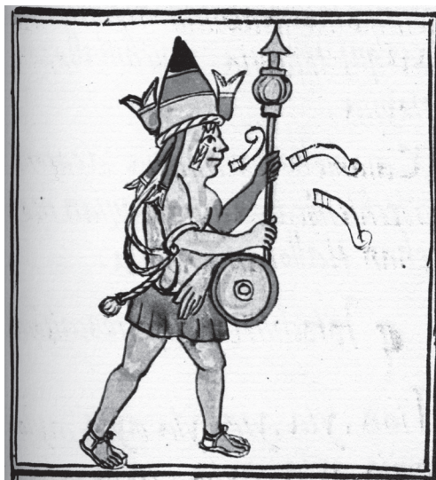
Figura 4. Xipe Totec (nuestro señor el desollado), el dios de la Tierra, el espíritu del campo, el dios de la fiesta de la primavera. Sahagún, Ms. Biblioteca Laurentiana