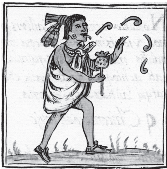
Figura 8. Atlauâ, el dios de Cuitlauac. Sahagún, Ms. Biblioteca Laurenziana