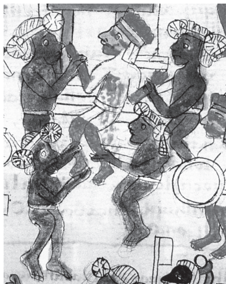
Figura 10. Los Chachalmeca, asistentes del sacerdote sosteniendo al sacrificado (representante de Huitzilopochtli) por las manos y los pies en la fiesta de Panquetzaliztli. Sahagún, Ms. Biblioteca del Palacio