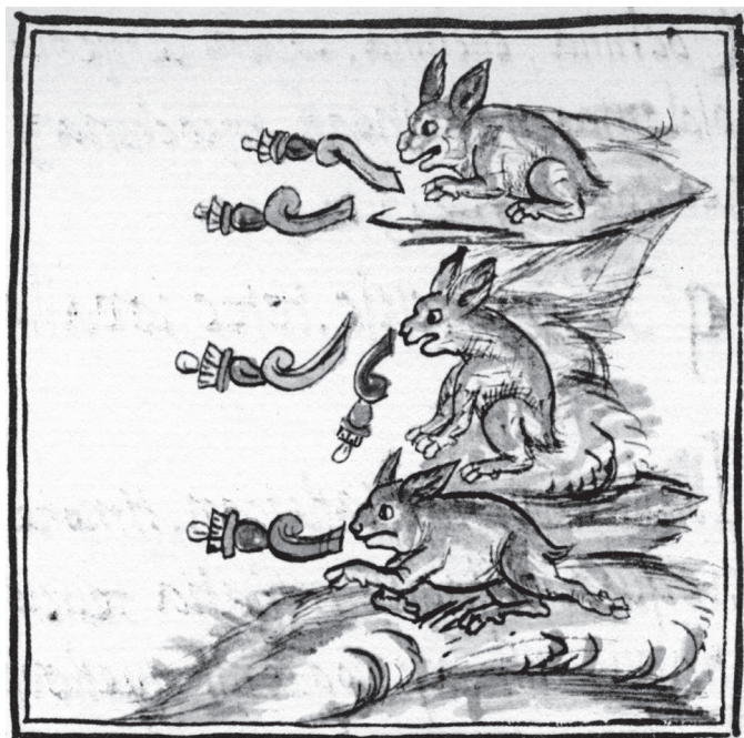
Figura 7. Los conejos cantando ( totochtin ), los dioses del pulque. Sahagún, Ms., Biblioteca Laurentiana

XVII.1. La primera estrofa contiene los ininteligibles tartamudeos sin sentido de un borracho, como dice el comentarista, es ytlaueicuic (su canción iracunda), la canción del dios irritado y enojado.