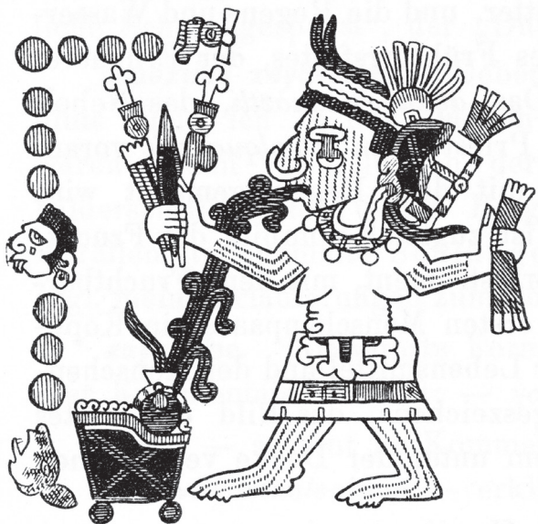
Figura 2. Ce maçatl (Uno ciervo). La primera de las cinco ciuateteô. Códice Borgia 47 (Kingsborough 68)