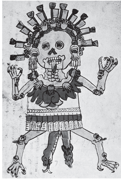
Figura 4. Tzitzímitl, representada como una figura esquelética, con manos y corazones en la cabeza y el collar. El pelo revuelto está adornado con banderines. Posee múltiples bocas con dientes afilados en las coyunturas, y sus garras son de ave, posiblemente de águila. Bajo su falda cuelga una serpiente cascabel, claramente asociada con los órganos genitales. Códice magliabechiano , folio 76r