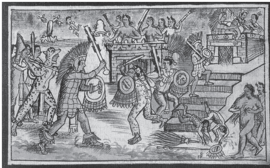
Figura 3. Las mujeres desnudas de Tlatelolco se presentan en la batalla, exprimiendo leche de sus pechos. En lo alto de uno de los templos gemelos, otras mujeres se exprimen leche y arrojan objetos contra los atacantes. Axayácatl aparece, primero en batalla, luego subiendo la escalera del templo, y finalmente, en el techo, aparentemente dispuesto a arrojar a Moquíhuix desde lo alto. Duran, Historia , capítulo 34

tivos en todos los sitios que alcanzamos”. 35 ¿Debemos considerar esta versión como más cercana a los hechos, o como un intento de los autores tlatelolcas por reivindicar a sus mujeres, denigradas por los vencedores? Sea como fuere, el énfasis en la participación de las mujeres es común a todos estos textos.