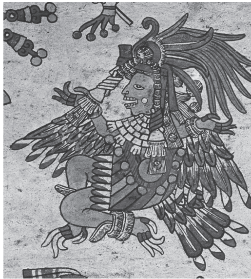
Figura 5. Itzpapálotl, con figura de águila, representada como patrona de la trecena de I Casa. Códice borbónico , página 15