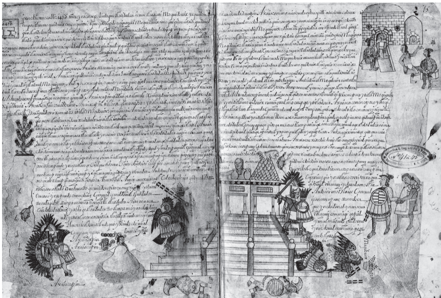
Figura 2. Vestido como águila, Moquihuix sube los escalones del Templo Mayor de Tlatelolco. Al lado derecho, yace al pie del templo, su cuerpo partido en dos. Axayácatl se alza triunfante en lo alto del templo. La mujer que aparece en el techo de uno de los templos gemelos puede estar relacionada con las mujeres que participaron, de un modo u otro, en la guerra. Códice Cozcatzin , folios 12v y 13r