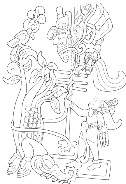
Figura 6. Estela 25 de Izapa. En el ala del gran pájaro nacen múltiples cabecitas de pájaros pequeños. La vagina dentada está representada por las fauces de aspecto serpentino, que aparecen en su vientre, sujeciendo el brazo cercenado del héroe. Dibujo del autor, basado en una fotografía por Hernando Gómez Rueda