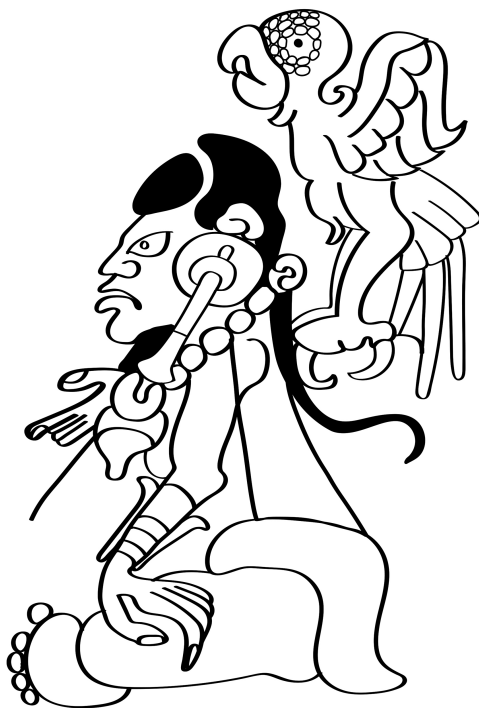
Figura 3. La guacamaya sobre la Diosa Ixchel en la página 16C del Códice de Dresde . Dibujo de Eduardo Salvador Rodríguez.

y la serpiente en los manuscritos de los Beatos es una adaptación de un pasaje proveniente de su Historia Natural , y claramente ése es el vínculo que se privilegia en la interpretación del mosaico del palacio de los emperadores cristianos de Constantinopla (siglo v o vi) 41 (Cid y Vigil, 1992: 123).