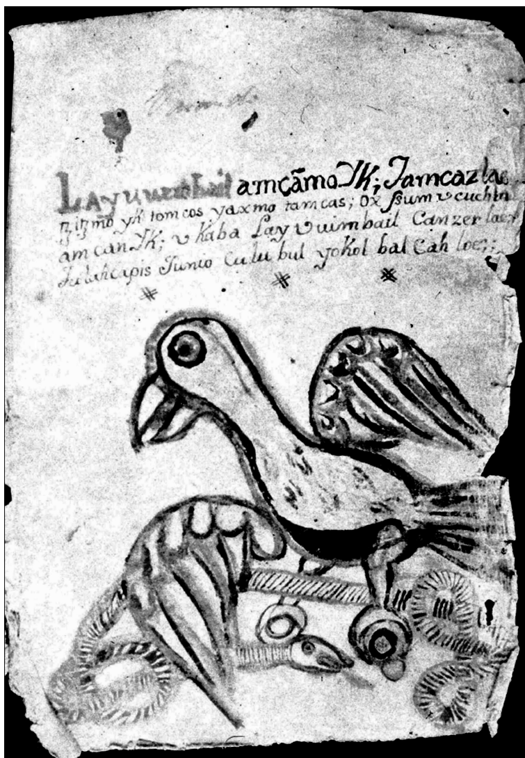
Figura 1. Página 3 del Chilam Balam de Kaua (Bolles y Bolles, s.f.: p. 3).

da más que trabajar con las copias de las fotografías hechas por Maler en algún momento anterior a 1887 (Bricker y Miram, 2002: 3) que son en blanco y negro.