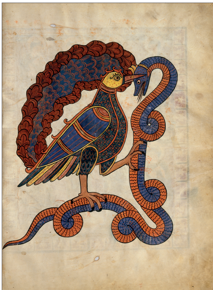
Figura 4. Uno de los ejemplos del ave y la serpiente en los Beatos . Beato de San Sever, folio 13.

Estos autores (Cid y Vigil, 1992: 116) demostraron con suficiente sustento que la miniatura fue creada para una Biblia en la región leonesa en los siglos IX o X y que pasó a los conocidos como Beatos en el momento en que éstos se ampliaron, siendo el Comentario apocalíptico quien le dio mayor difusión.