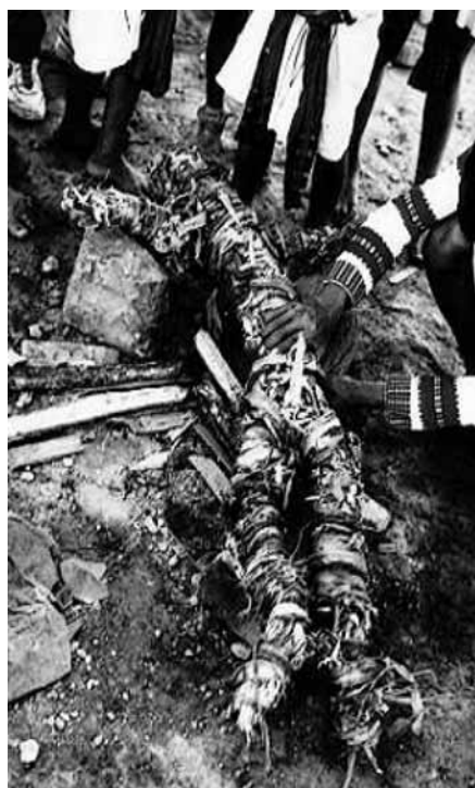
Figura 2 . Foto del autor