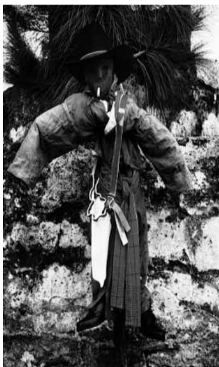
Figura 1.

Es interesante que varios amigos tzeltales asociaran espontáneamente esta maniobra de fabricación de un cuerpo-presencia por parte de un alma-espíritu con la manufactura del muñeco xutax , es decir, la imagen de Judas tal y como se representa durante la Semana Santa. Los indígenas de Chiapas confeccionan este personaje con una chaqueta y pantalones de fieltro rojo, sombrero, botas, un morral de redecilla, y una máscara de madera ya ennegrecida por el humo del los cigarrillos que se encajan en su boca y que una vez encendidos se consumen lentamente (un alimento muy apropiado para un espíritu). El muñeco se cuelga entonces en la cruz del atrio de la iglesia (figura 1). La ropa está rellena de hojas secas de árbol del plátano (la antítesis de la carne), las cuales se queman o hacen estallar con pólvora al acabar la celebración (figura 2). Ahora bien, la efigie de este muñeco se llama en tzeltal precisamente winkilel , es decir, cuerpo-presencia, y a él solían remitirse mis informantes cuando preguntaba acerca de este cuerpo. 20