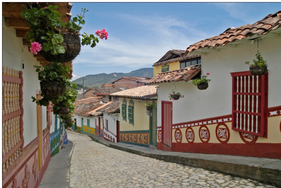
Imagen 1. Zócalos de las casas en la calle del Recuerdo