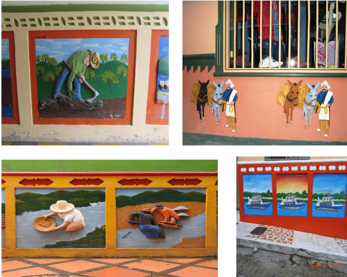
Imagen 3. Representación de actividades económicas en los zocalos de Guatapé