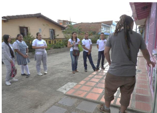
Imagen 7. Recorrido por Guatapé con los estudiantes y el zocalero

Las características del municipio de Guatapé en relación con los zócalos permitió realizar salidas de campo donde los estudiantes interactuaron de una manera directa con las fuentes, pues el trabajo fuera del aula fortalece la investigación histórica y, a partir de la observación, confrontaron teorías y conocimientos previos del tema a investigar. Los recorridos se realizaron con un zocalero, quien guiaba la ruta y atendía todas las inquietudes de los estudiantes.