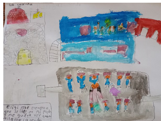
F. La calenda