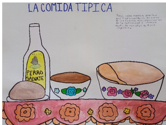
E. La comida típica