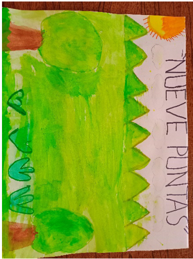
A. Cerro nueve puntas