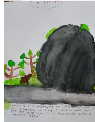
B. La piedra