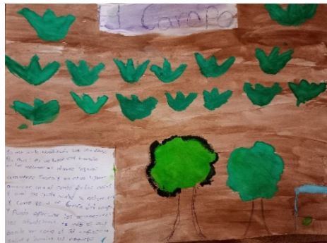
C. El campo