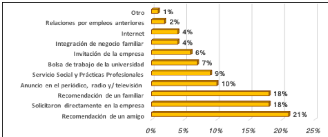
Figura 3. Medios utilizados por los contadores para conseguir empleo