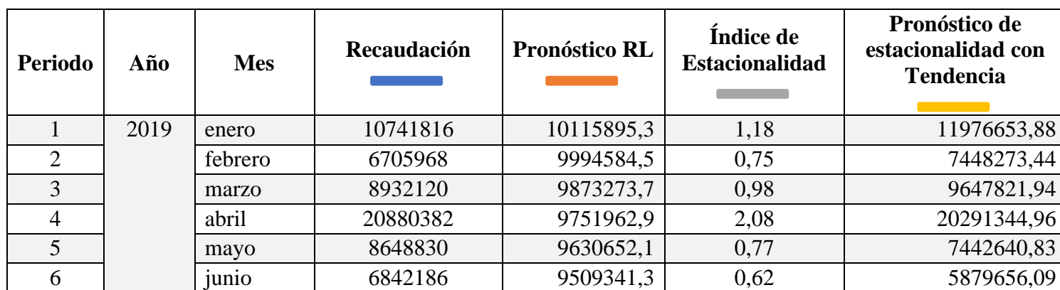
Tabla 3: Pronóstico de la recaudación por tipo de impuesto del SRI.

Se puede evidenciar, que durante el semestre del 2020, una deficiencia constante en los últimos meses, la recaudación ha bajado de una manera drástica del mes de abril, mayo y junio y no se ha podido recuperar totalmente. Esta baja económica no solo es en la provincia de Imbabura, sino también en las distintas provincias de Ecuador.