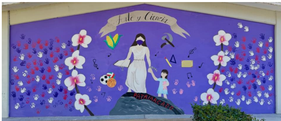
Figura 4 Mural “Mujeres”

Aunado a esta lucha de identidad y valoración social hacia la mujer, algunas alumnas de la Normal Rural de San Marcos, en conjunto con algunas docentes, elaboraron en el marco de la conmemoración del 8 de marzo de 2024, día de la mujer, un mural que representara los conflictos que enfrenta la mujer sanmarqueña, rodeado del contexto de una maestra rural (Figura 4).