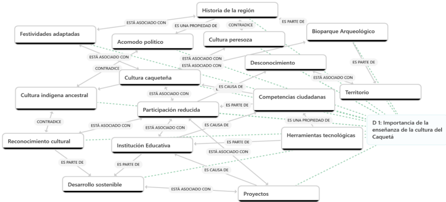
Diagrama de red de la importancia de la enseñanza de la cultura caquetense