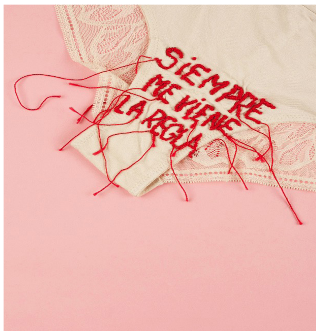
FIGURA 1: SIEMPRE ME VIENE LA REGLA