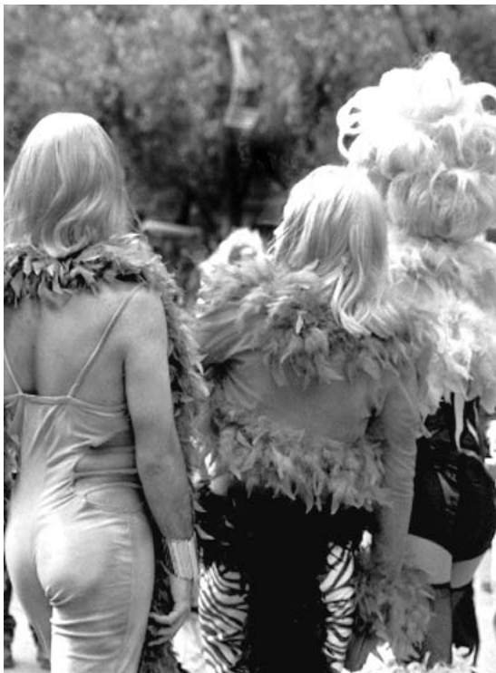
Marcha del orgullo lésbico-gay, ciudad de México, 2001

la segunda de Leslie, como su guardiana y su portavoz. Tania es muy aguda, verbalmente bien articulada y permanentemente está bromeando y coqueteando. Es bastante pequeña y cuando se encuentran todas en la calle es una de las vestidas con más estilo. Se considera a sí misma como un hombre homosexual pasivo y se muestra orgullosa tanto de su sexualidad como de su trabajo. Es muy abierta en cuanto a su sexualidad y le gusta hablar de sus gustos en estos dominios, pero en cuanto a información de tipo personal es más reservada.