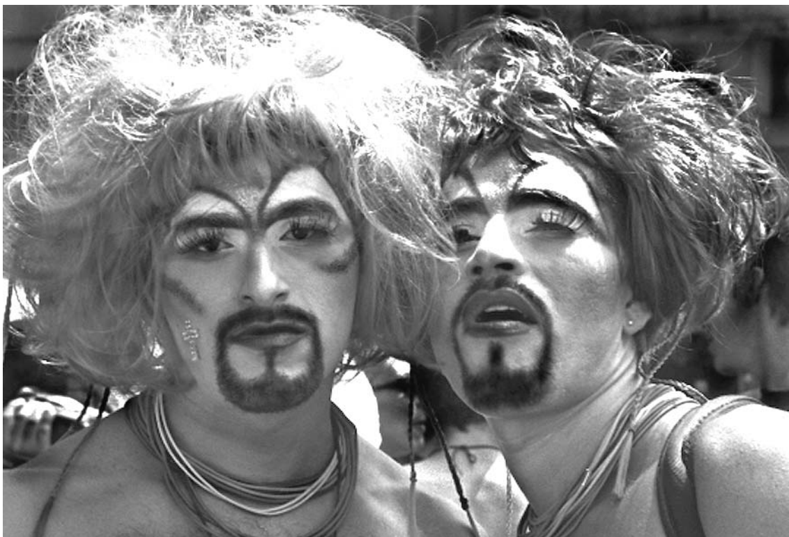
Marcha del orgullo lésbico-gay, ciudad de México, 2001