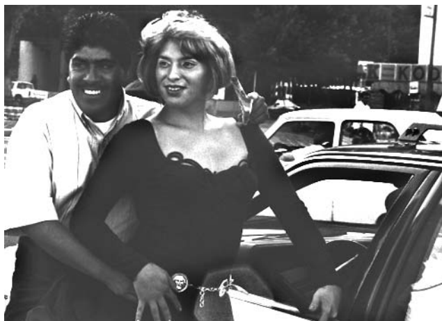
Marcha del orgullo lésbico-gay, ciudad de México, 2000

Estoy consciente de que algunas personas puedan pensar que no soy una buena madre por mi trabajo y mi estilo de vida, pero, ¿sabes qué? Ése es su problema, no el mío. Yo te pregunto, ¿qué es más importante: que esta niña tenga casa y reciba amor, o mi trabajo y forma de vida? Esta niña viviría en la calle si no la hubiéramos adoptado. ¿Es mejor para la niña vivir en la calle o en una casa de “jotos” que la quieren?