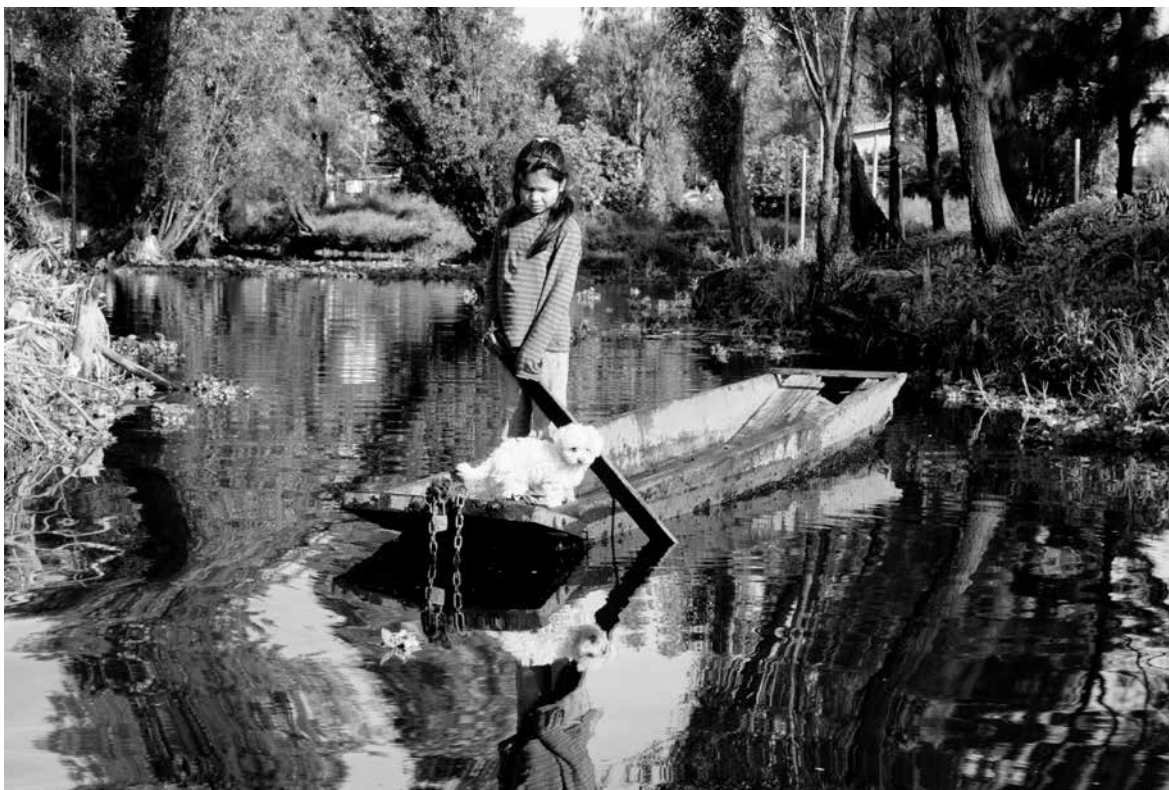
PROMETEO LUCERO ► Una niña pasea en chalupa con su perro por los canales de Xochimilco. Ciudad de México, 16 de julio de 2011.

país y a su comunidad, y de cuánta confianza tienen ellos y las personas a las que entrevistaron en las instituciones. Los estudiantes respondieron cuestionarios y los aplicaron a cuatro personas de su confianza. Las preguntas fueron: