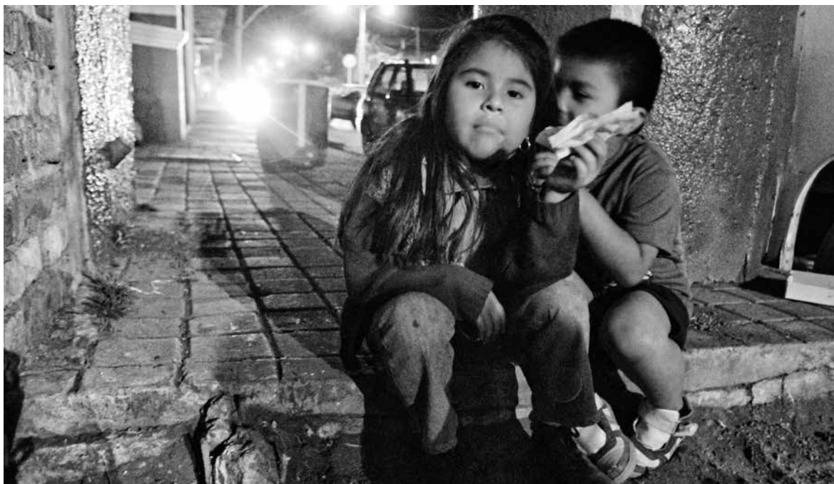
CONSUELO PAGAZA ► Habitantes de Cherán durante las celebraciones del segundo aniversario del inicio de la lucha por la defensa de sus bosques. Michoacán, México, 2013.

hasta recibir respuesta oficial, también en náhuatl. Al final, las respuestas oficiales llegaron en náhuatl.