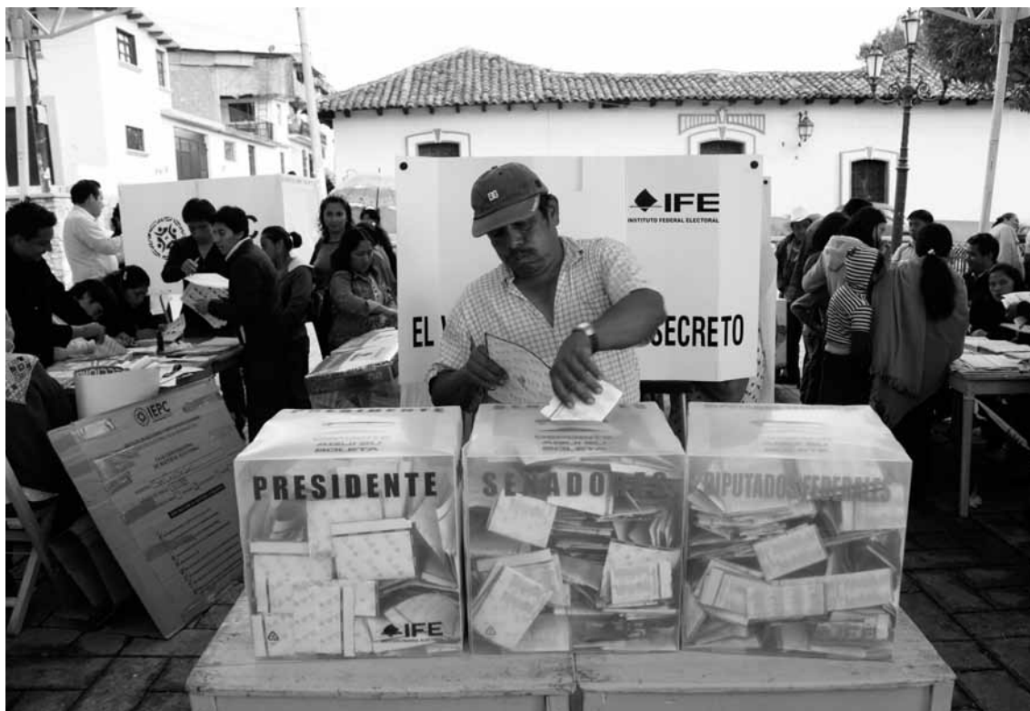
San Cristóbal de Las Casas, Chiapas, 2012.